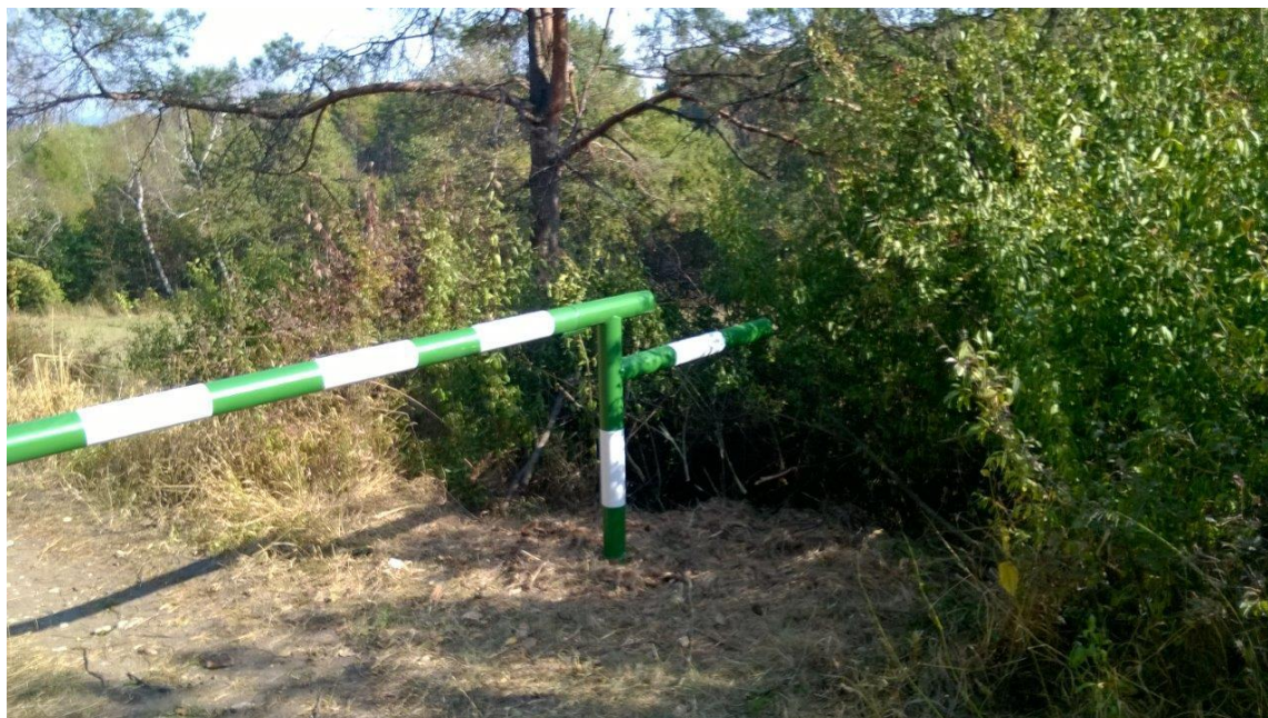
Ryc.3 Słupek zamykający