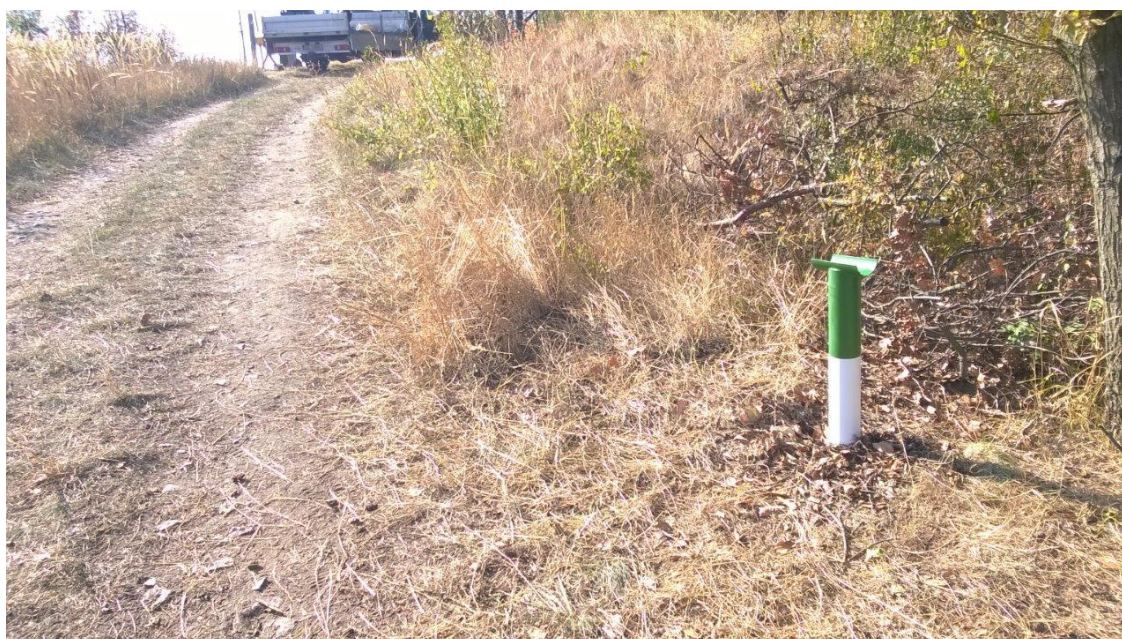
Ryc.4 Podpora wykorzystywana na czas otwarcia szlabanu