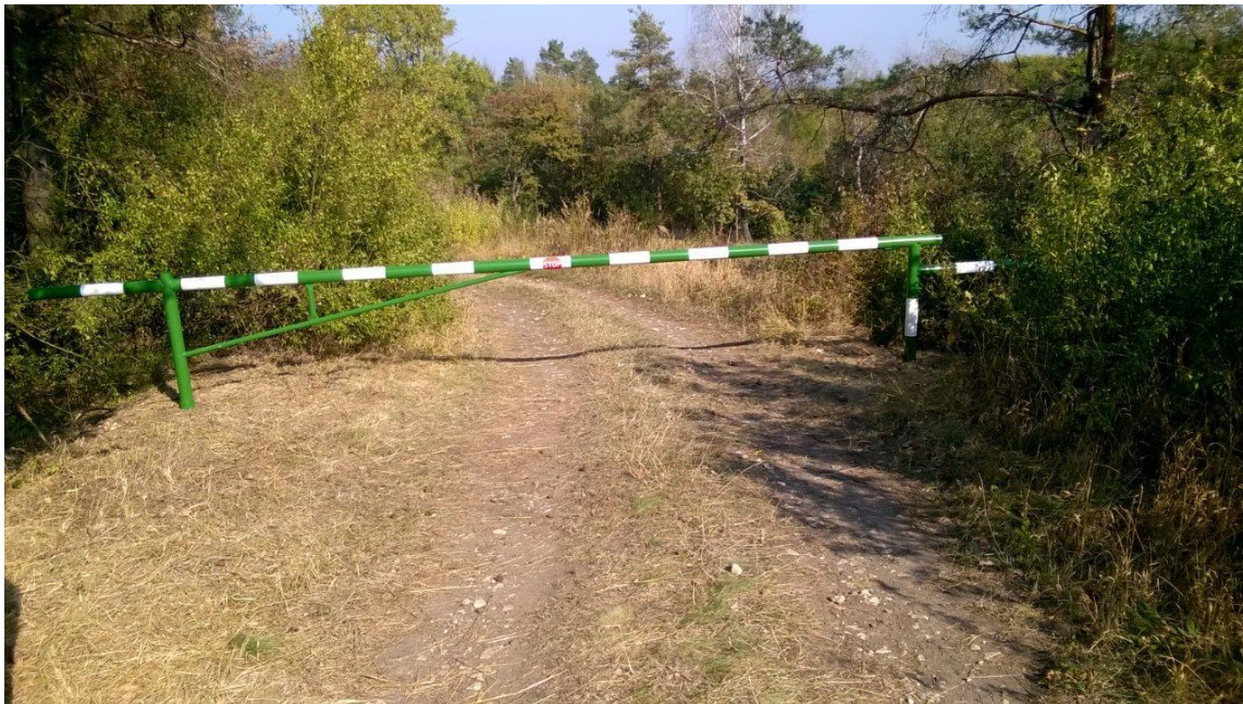
Ryc. 2 Wygląd ogólny szlabanu