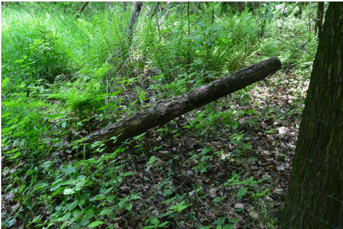
Ryc.1 Słupek drewniany do wymiany oraz siatka do naciągnięcia/wymiany