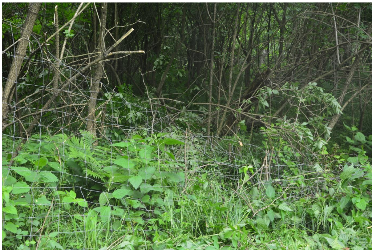
Ryc.3 Uszkodzona siatka do wymiany