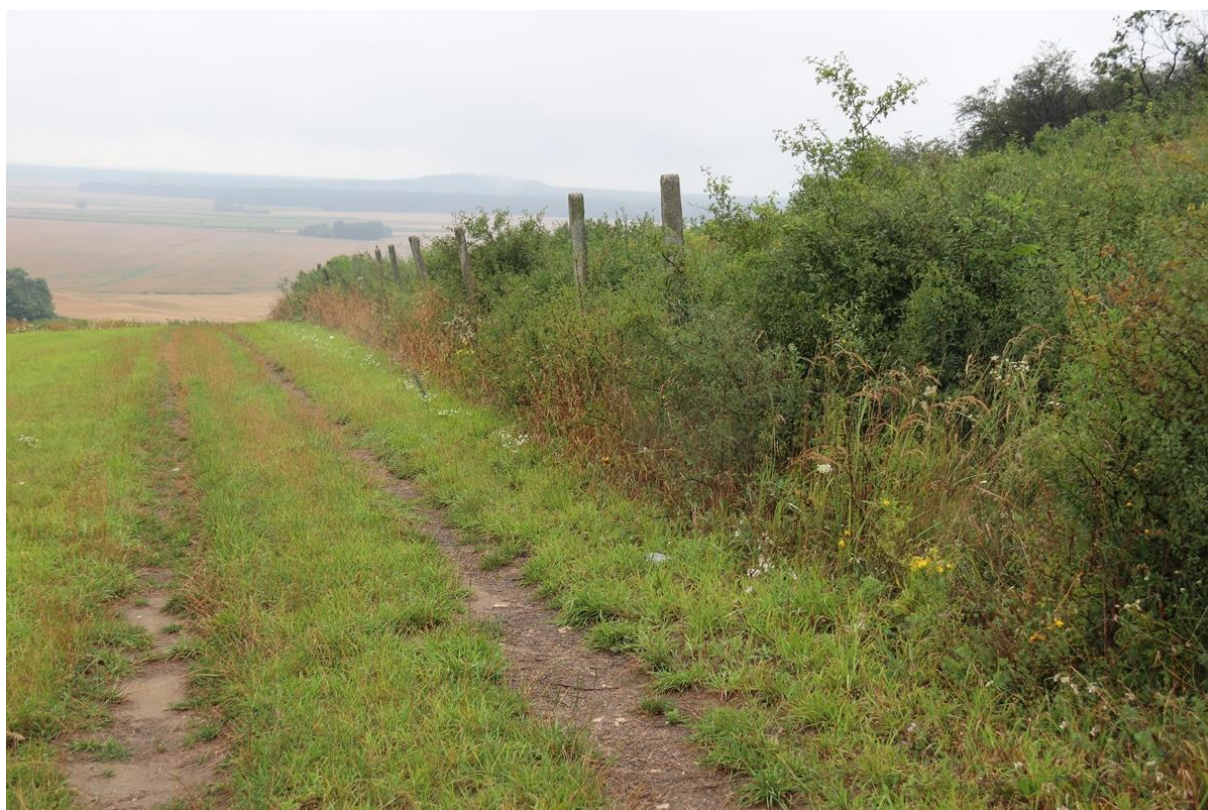
Zdj. 1. Przebieg ogrodzenia wzdłuż południowej granicy działki