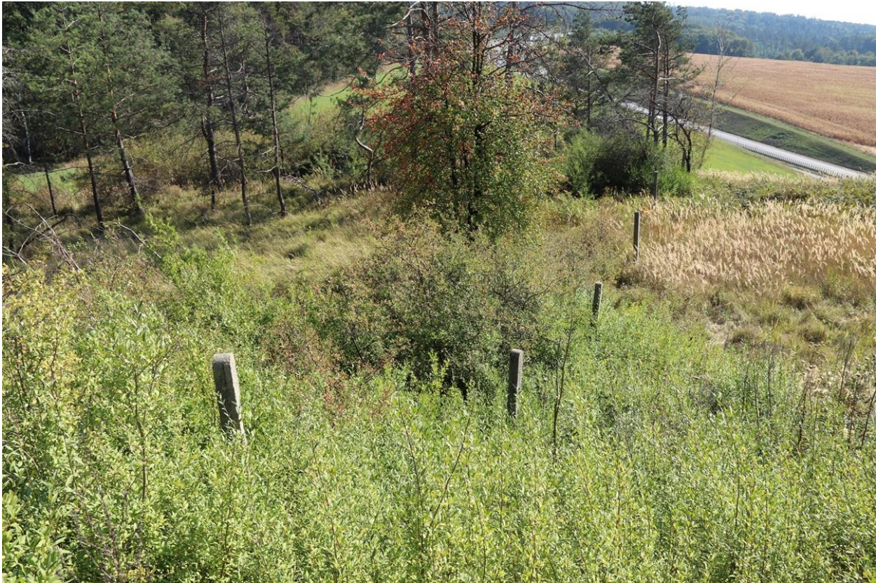
Zdj. 2. Wschodnia granica działki – przebieg ogrodzenia po zboczu