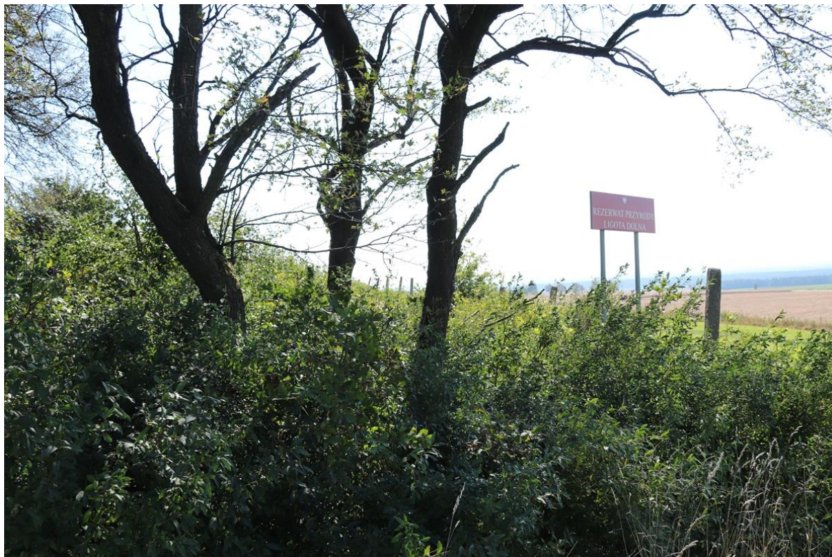
Zdj. 3. Zachodnia granica działki – początek ogrodzenia