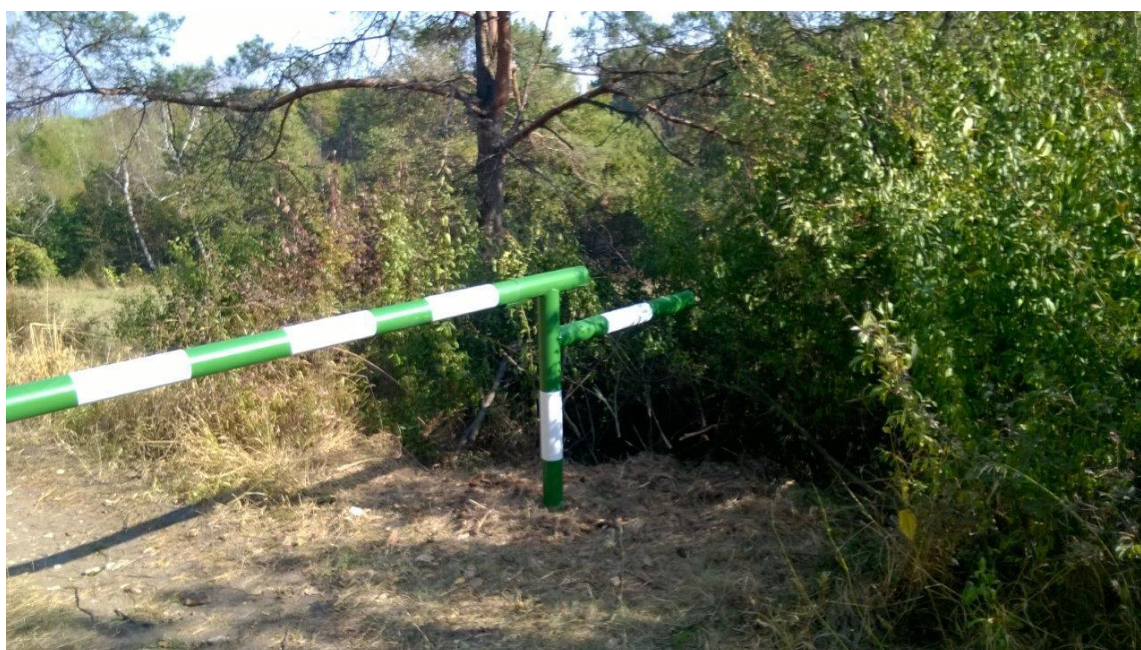
Ryc.3 Słupek zamykający