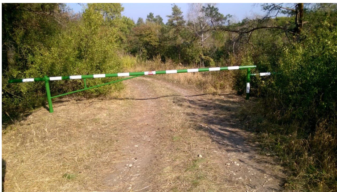
Ryc.2 Wygląd ogólny szlabanu