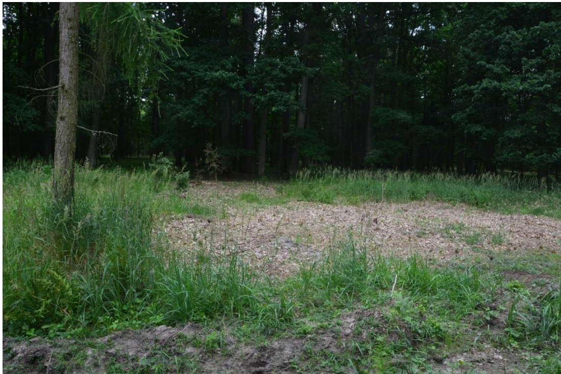
Ryc. 2 Płat rdestowca ostrokończystego w RP Jaśkowice w dniu 5.07.2021 r.