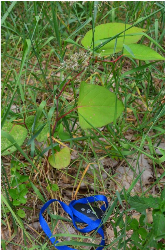
Ryc.4 Osobnik do 30 cm wysokości