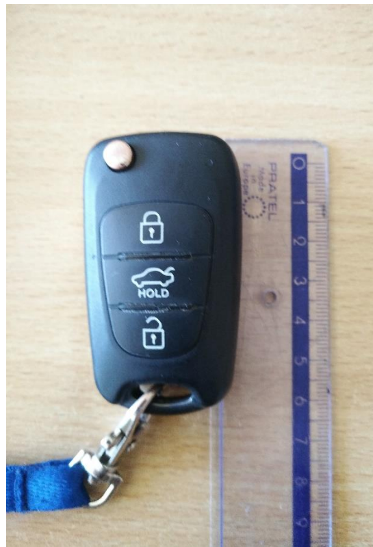
Ryc.5 Klucz będący miarą na ryc.3 i ryc.4