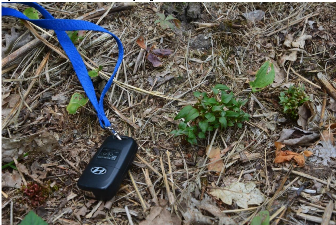
Ryc. 3 Skarłowaciałe osobniki rdestowca ostrokończystego w RP Jaśkowice – forma krzewinki