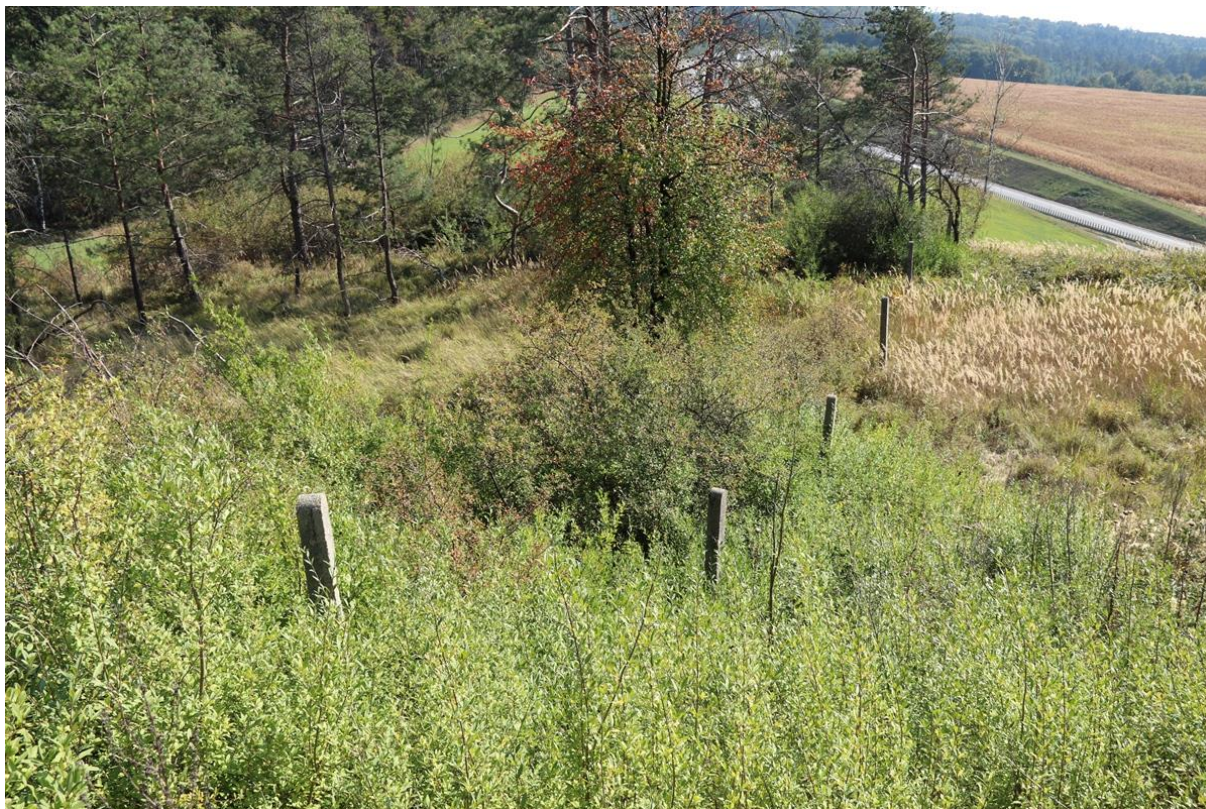
Zdj. 2. Wschodnia granica działki – przebieg ogrodzenia po zboczu