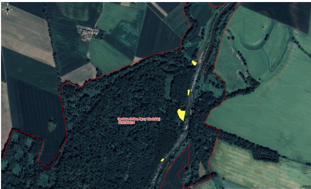
Rys. 5. Mapa pogładowa – powierzchnie występowania rdestowców (5/8)