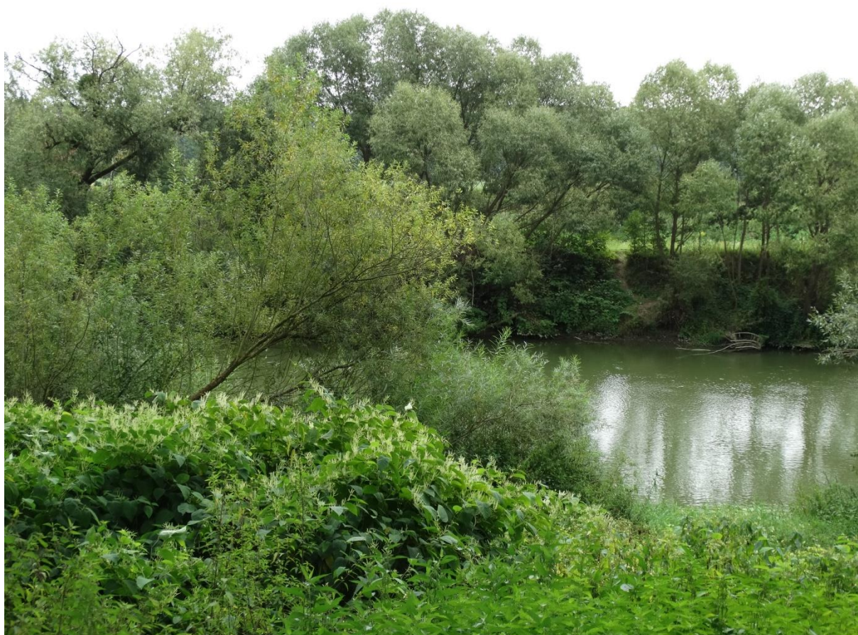
Fot. 2. Rdestowiec na skarpach koryta Nysy Kłodzkiej