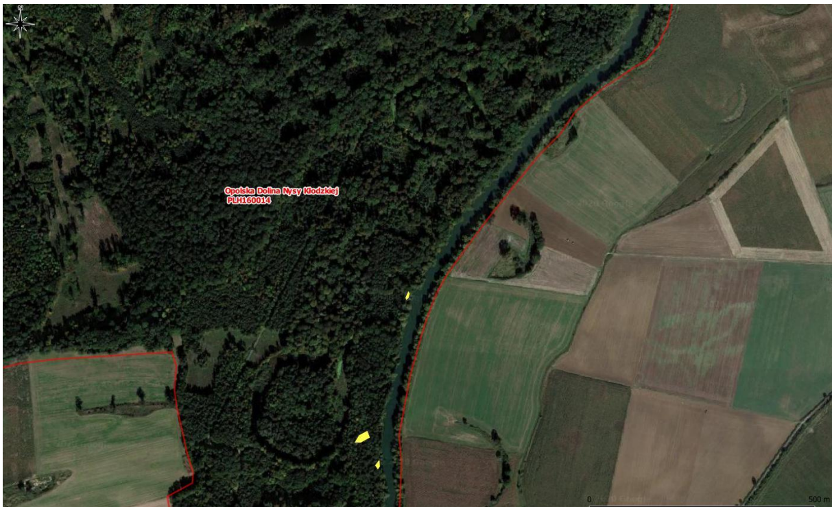
Rys. 2. Mapa poglądowa – powierzchnie występowania rdestowców (2/8)