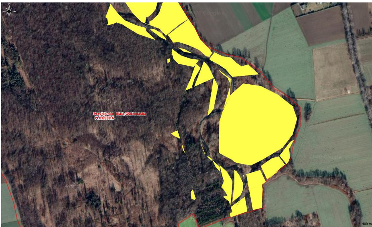
Rys. 2. Mapa poglądowa – powierzchnie występowania rdestowca w płatach siedlisk 91E0 i 91F0 (2/2)