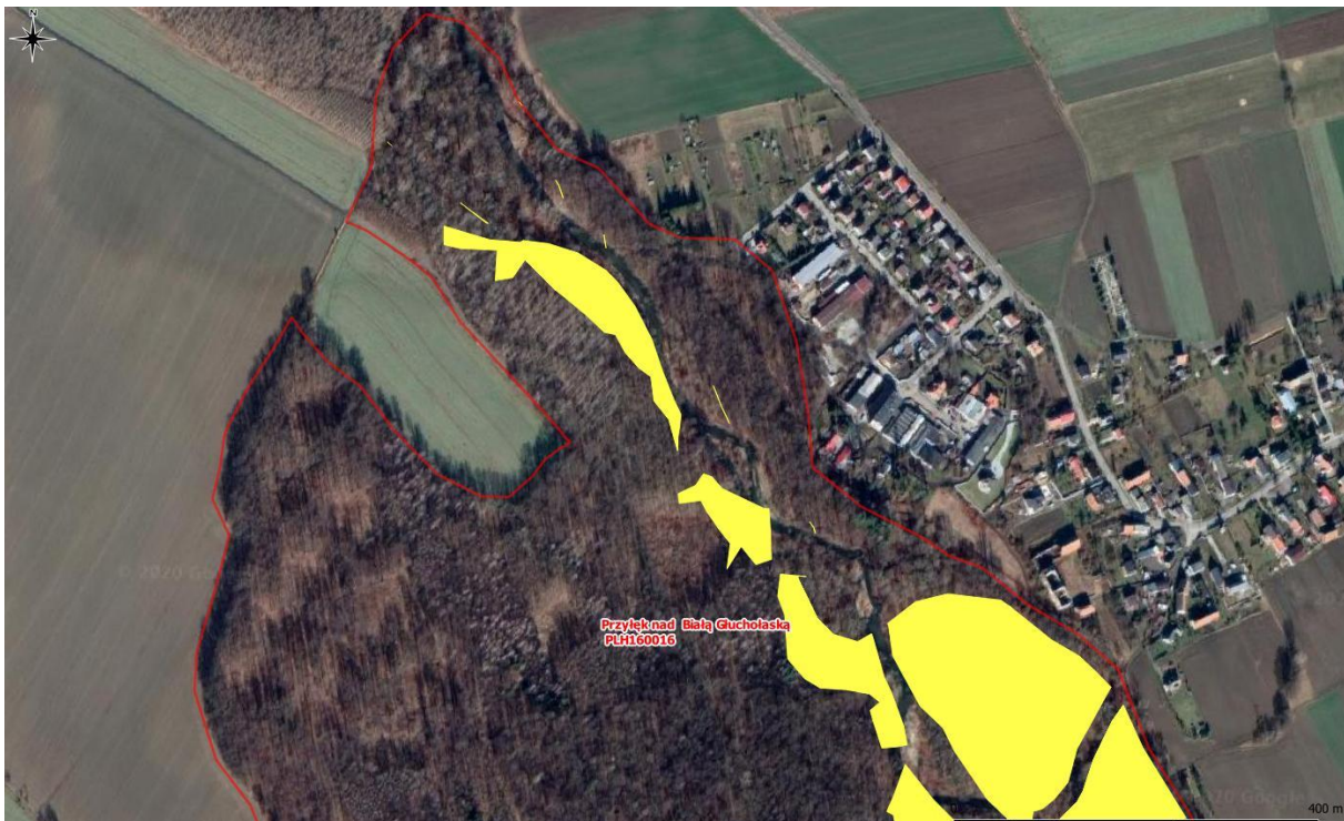
Rys. 1. Mapa poglądowa – powierzchnie występowania rdestowca w płatach siedlisk 91E0 i 91F0 (1/2)