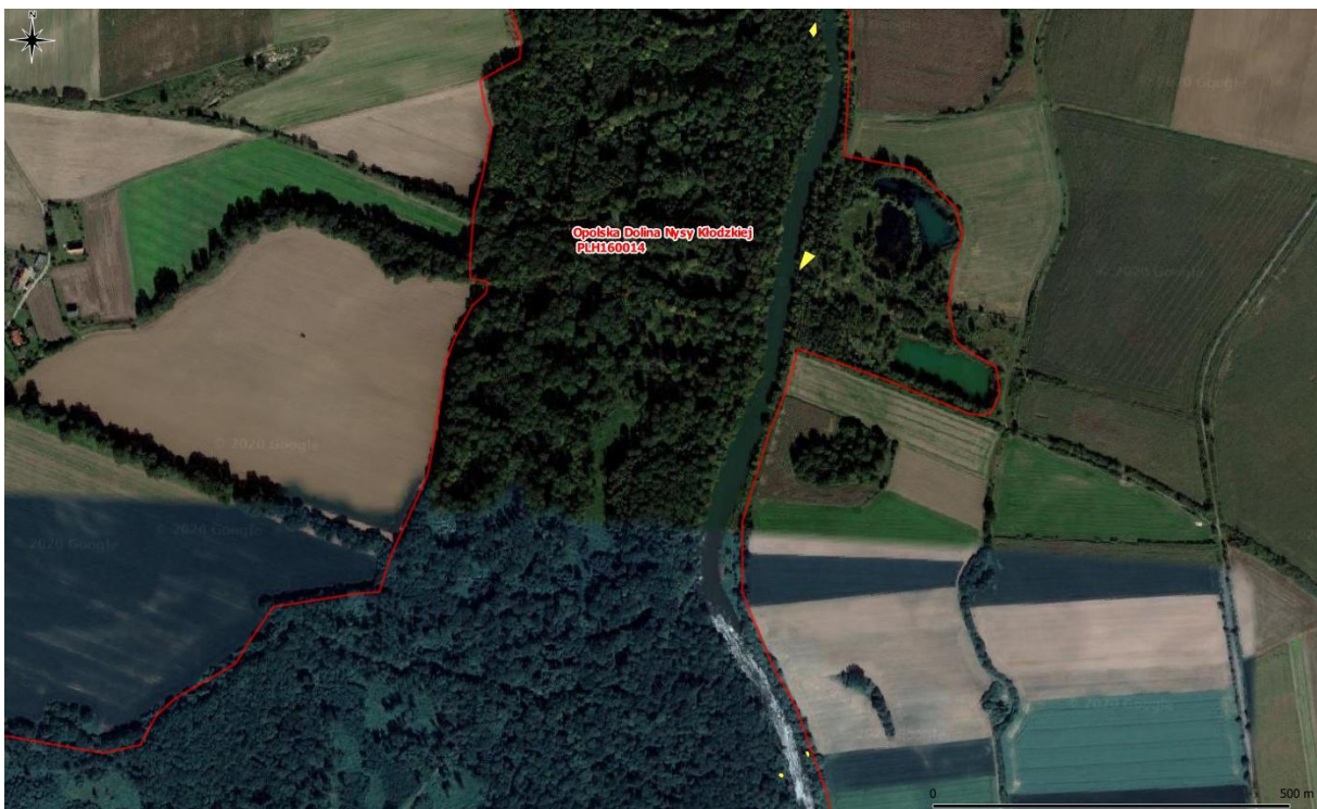
Rys. 3. Mapa poglądowa – powierzchnie występowania rdestowców (3/8)