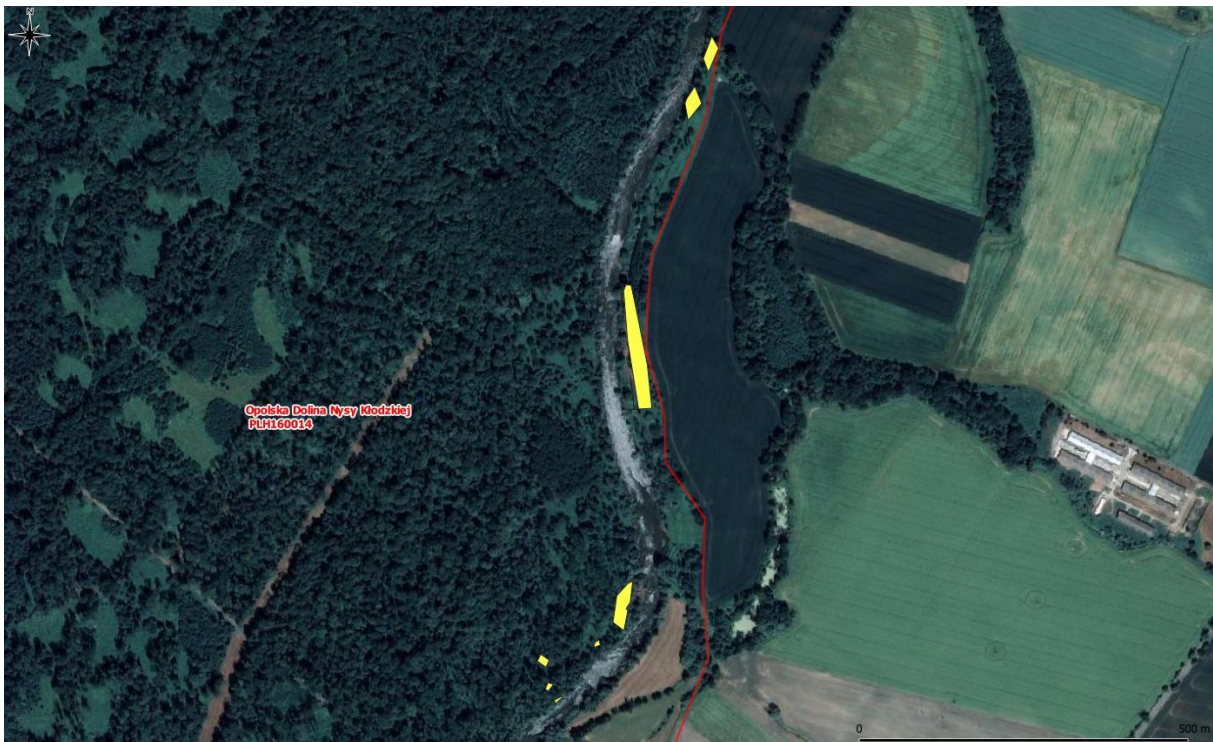
Rys. 6. Mapa pogładowa – powierzchnie występowania rdestowców (6/8)