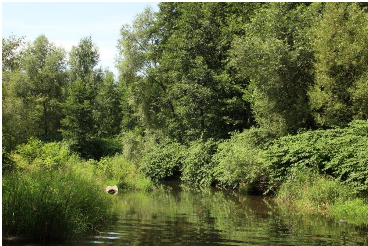
Fot. 1. Rdestowiec w obszarze Natura 2000 Przyłęk nad Białą Głuchołaską

*w nawiązaniu do sprawy nr WPN.600.92.2020 oraz przedstawionego w tej sprawie stanowiska RDLP Katowice w przypadku stosowania środków chemicznych i certyfikatów FSC.