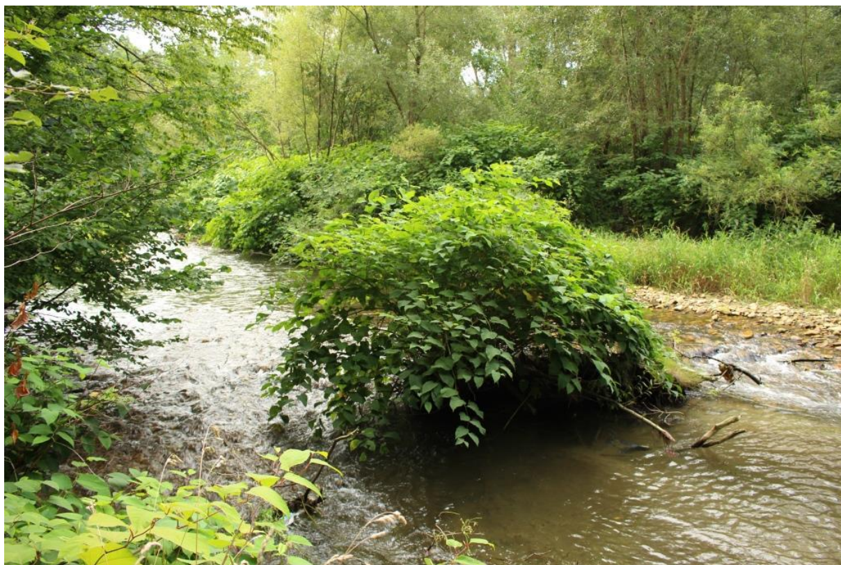
Fot. 2. Kępa rdestowca w korycie rzeki Biała Głuchołaska