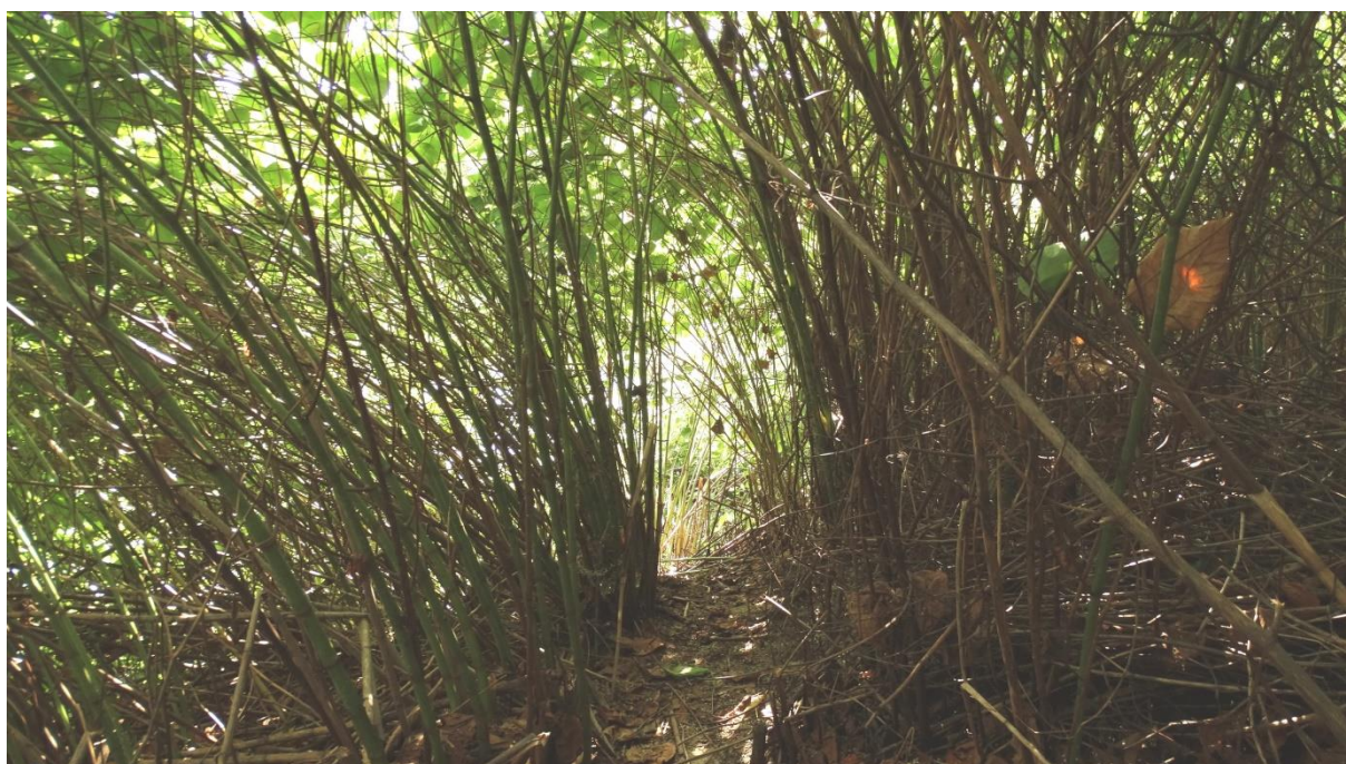
Fot. 1. Zwarte płyty rdestowca utrudniające poruszanie się po obszarze