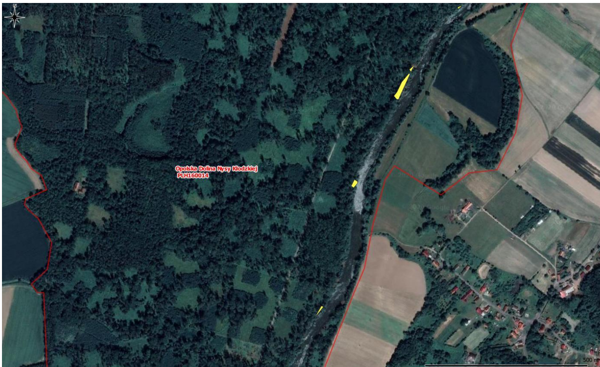
Rys. 7. Mapa pogładowa – powierzchnie występowania rdestowców (7/8)