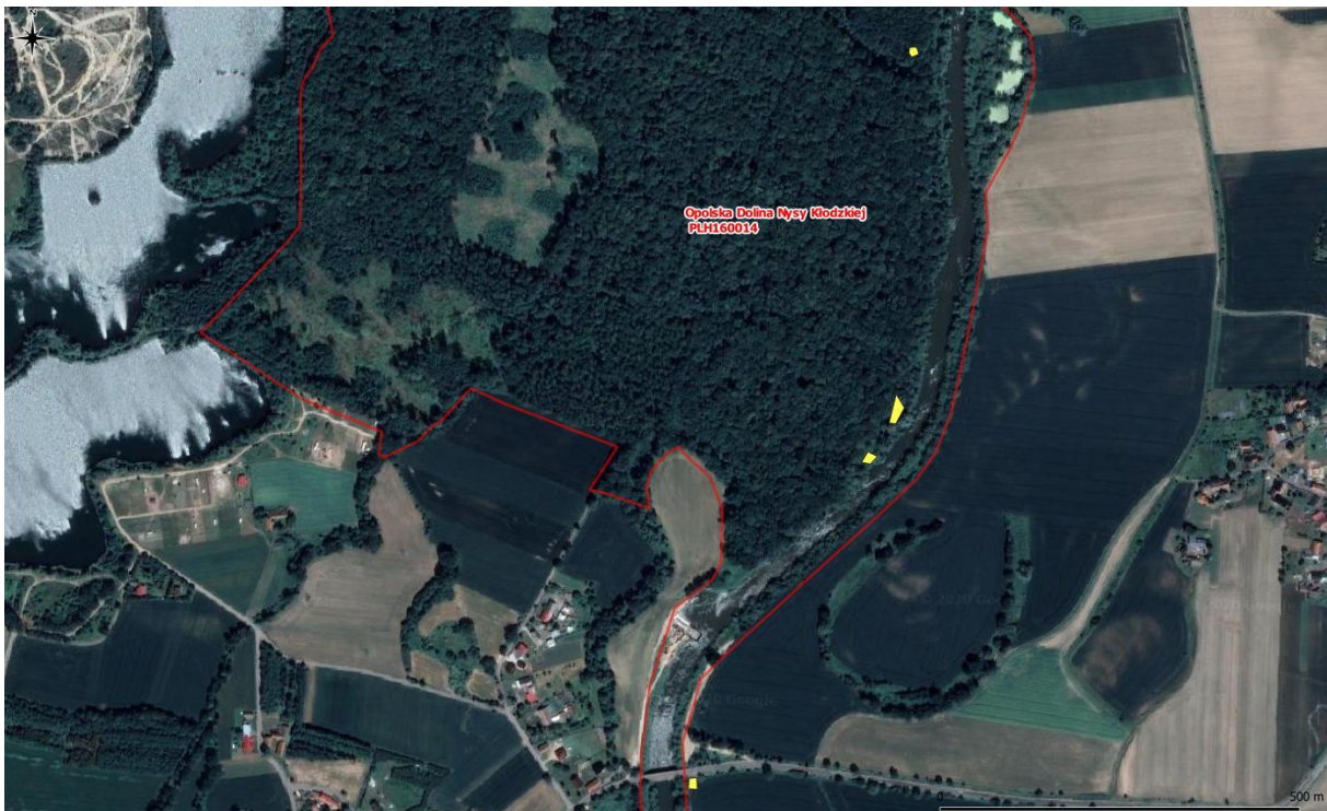
Rys. 4. Mapa pogładowa – powierzchnie występowania rdestowców (4/8)