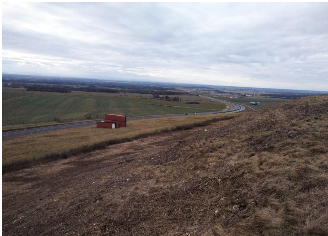
Fot. 3. Powierzchnia przeznaczona do wykaszania na południowym i południowo-zachodnim zboczu (zdjęcie wykonane po zabiegach ochronnych)