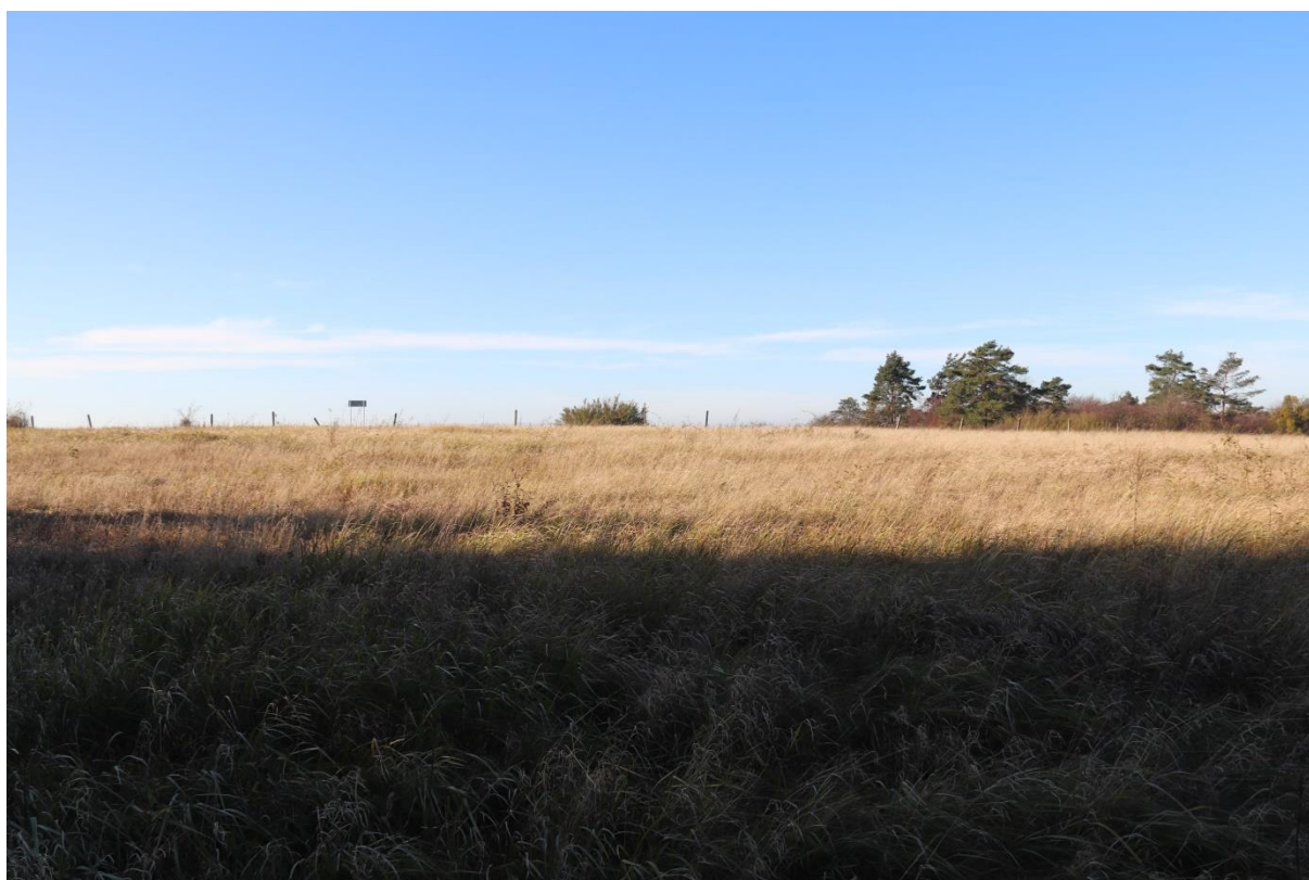
Fot. 1. Powierzchnia przeznaczona do wykaszania na wypłaszczeniu rezerwatu.