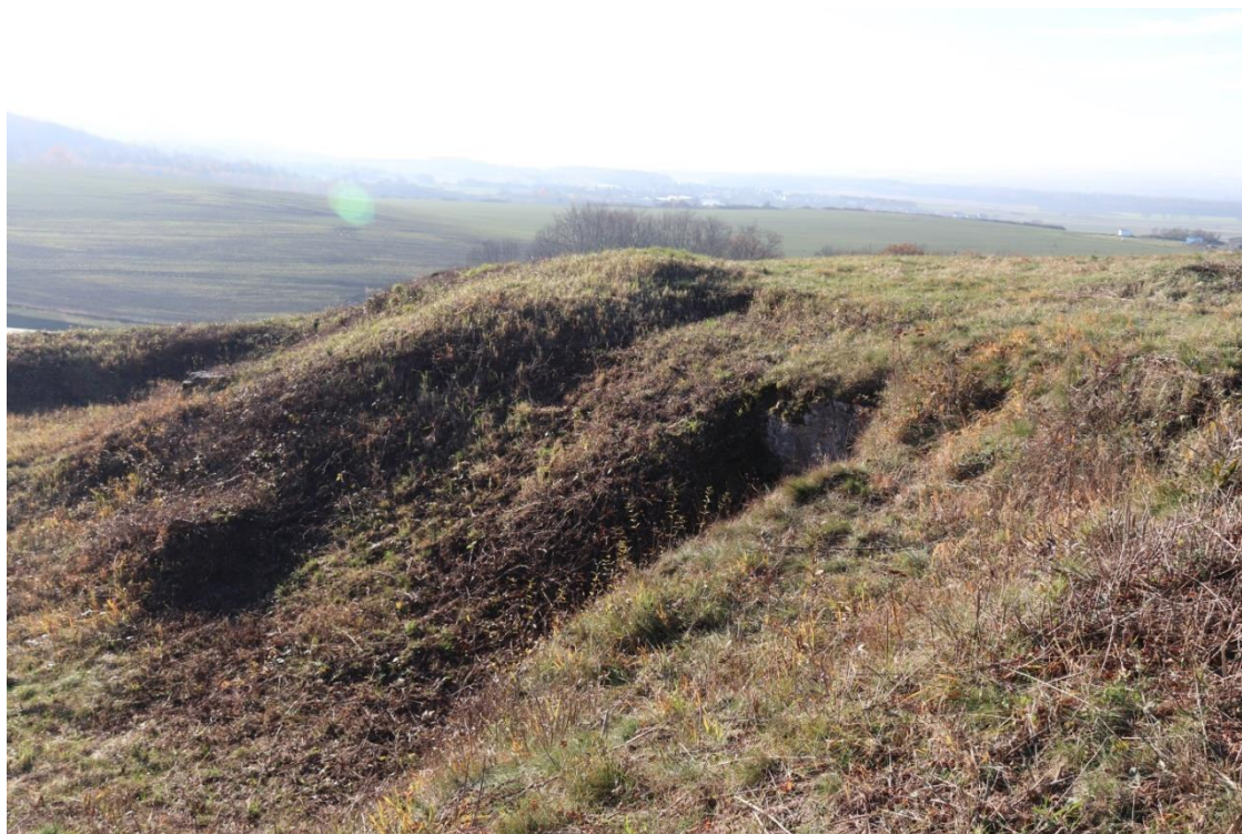
Fot. 2. Powierzchnia przeznaczona do wykaszania na południowo-wschodnim zboczu.