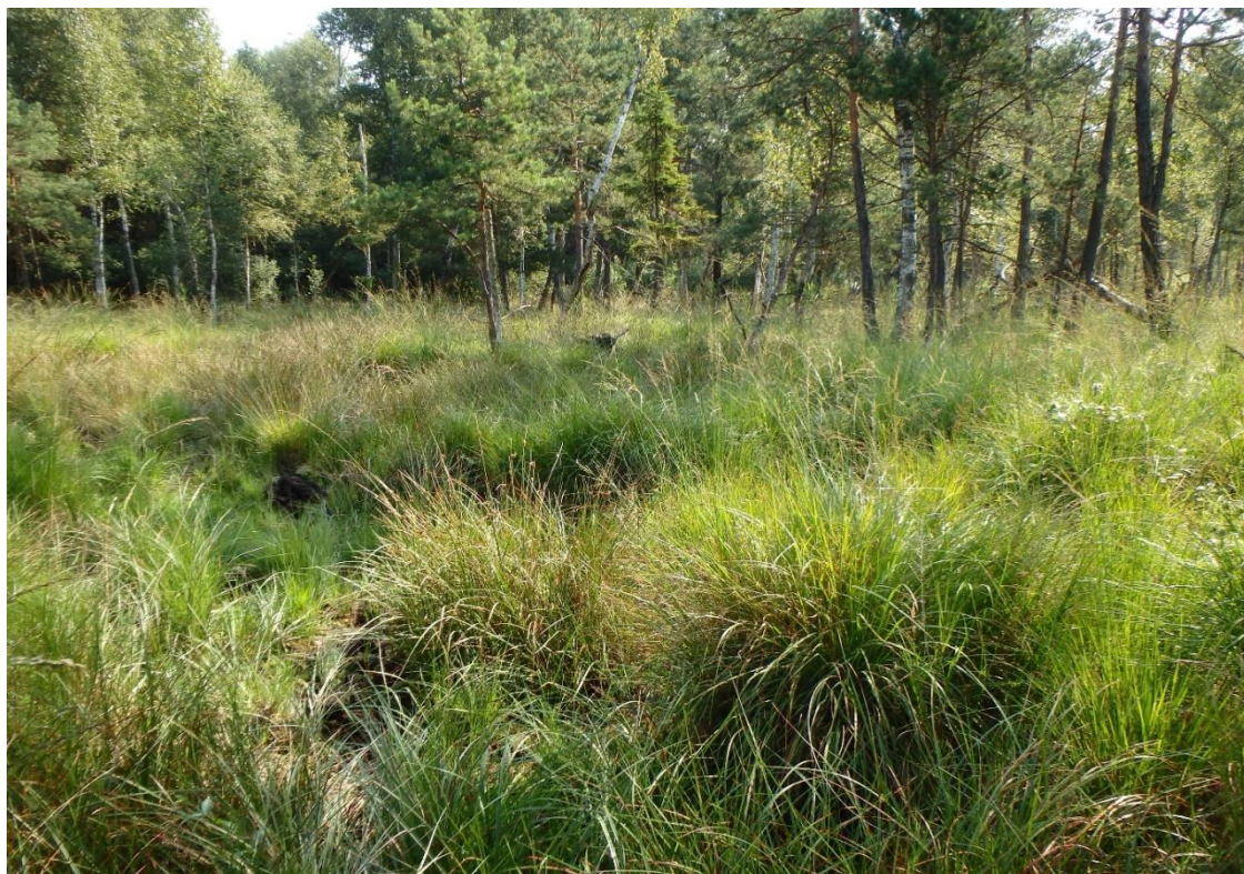
Fot. 1. Widok ogólny stanowiska (rezerwat przyrody „Prądy” teren silnie podmokły i bagienny)