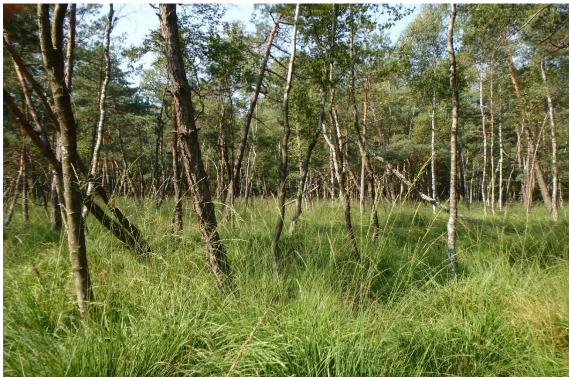
Fot. 2. Widok ogólny stanowiska (rezerwat przyrody „Prądy”)