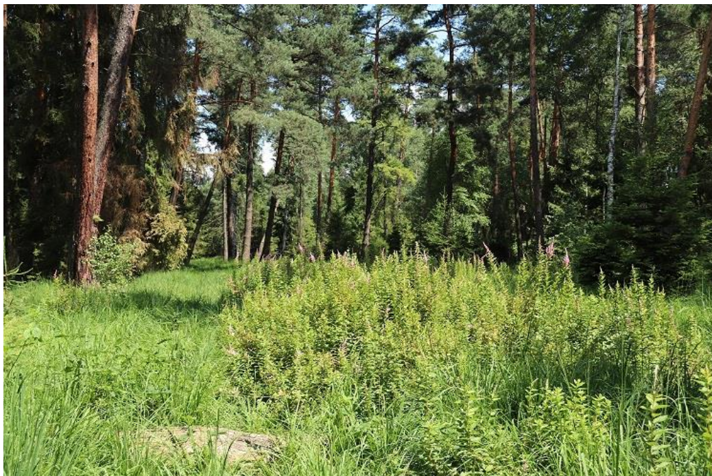
Fot.1. Płat zwartej tawuły porastający brzegi cieków wodnych w obszarze objętym pracami.

z uwzględnieniem wydzieleń leśnych oraz dróg gruntowych.