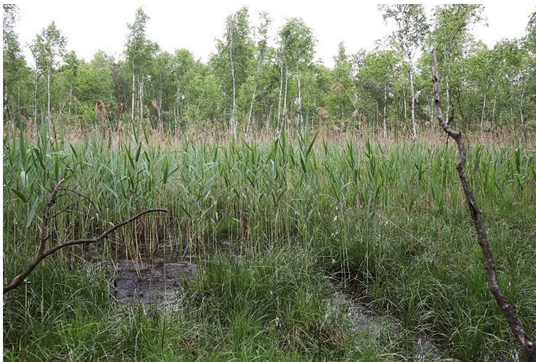
Fot. 1. Widok ogólny stanowiska: rezerwat przyrody „Prądy” (teren silnie podmokły i bagienny).

Miejsca prowadzenia zabiegów (tj. miejsca koszenia trzciny pospolitej objętych zamówieniem oraz miejsc pozostawienia biomasy w terenie) zostaną wskazane Wykonawcy przez Zamawiającego po podpisaniu umowy, w uzgodnionym wcześniej terminie. Wskazanie odbędzie się w godzinach pracy Zamawiającego (pn.-pt. w godz. 7.30 – 15.30).