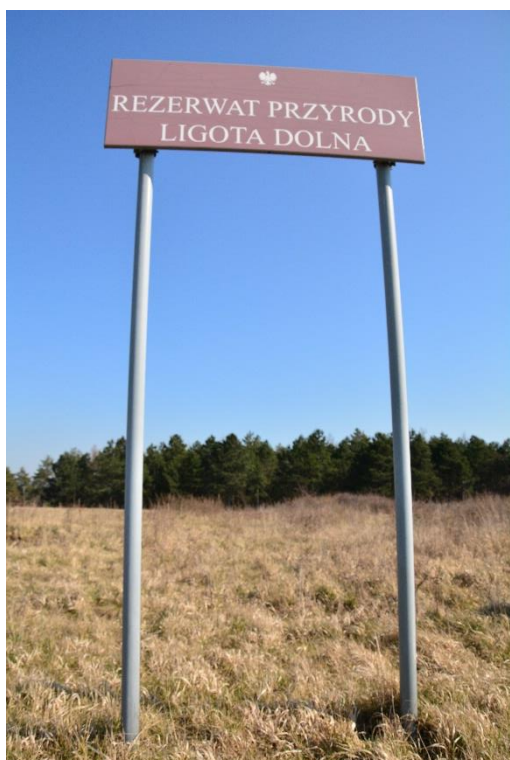
Ryc. 5 RP Ligota Dolna – tablica do demontażu