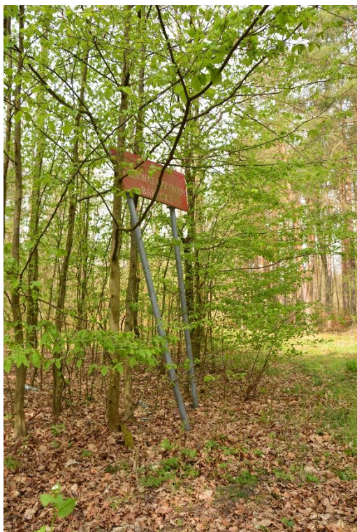
Ryc.1 RP Barucice – tablica do naprawy