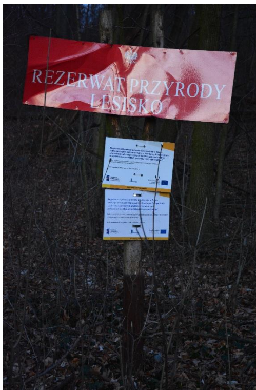
Ryc.4 RP Lesisko – tablica do demontażu