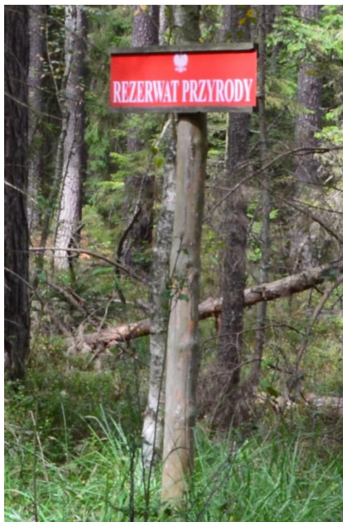
Ryc.2 RP Kamieniec – tablica do demontażu