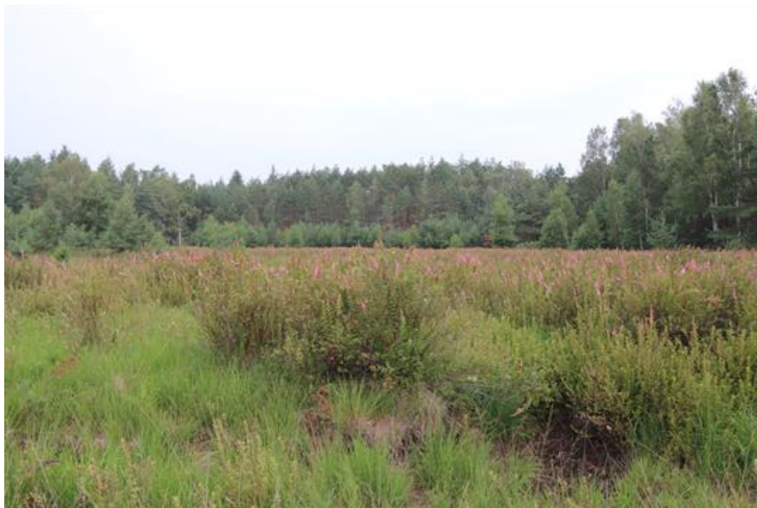
Fot.1. Płaty tawuły w wydzielaniu 44d- widok w kierunku północnej części wydzielania.