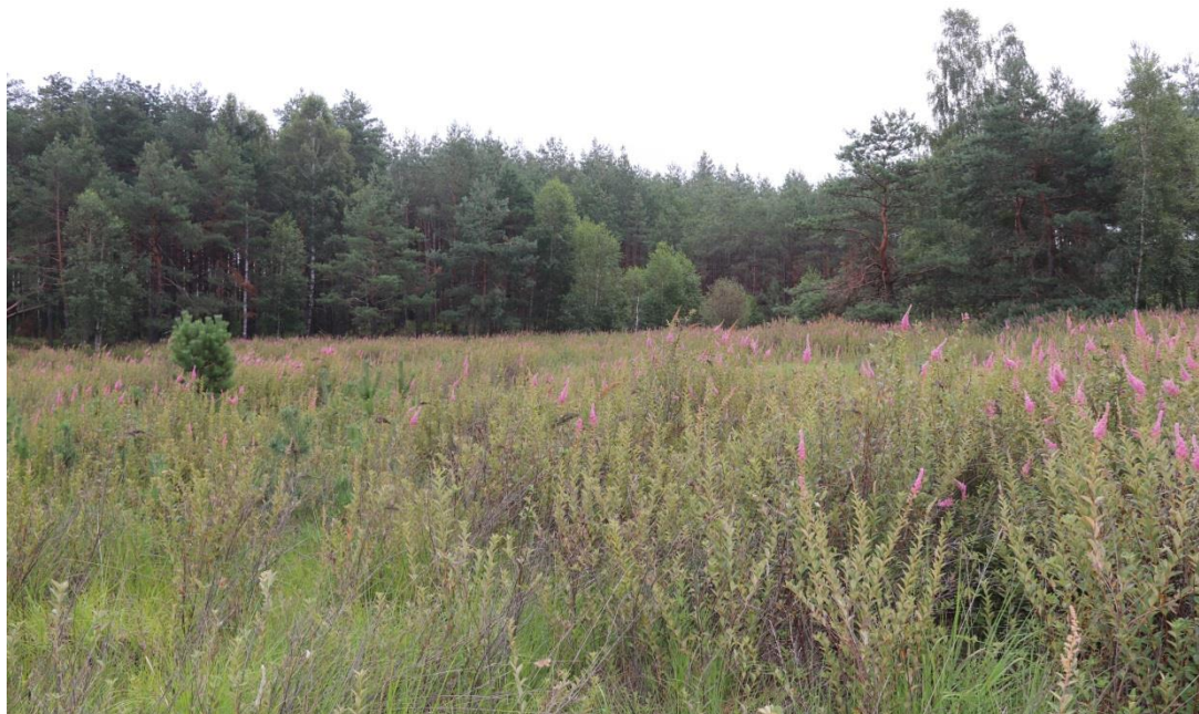
Fot.2. Płat zwartej tawuły w południowo- wschodniej części wydzielenia 44d.