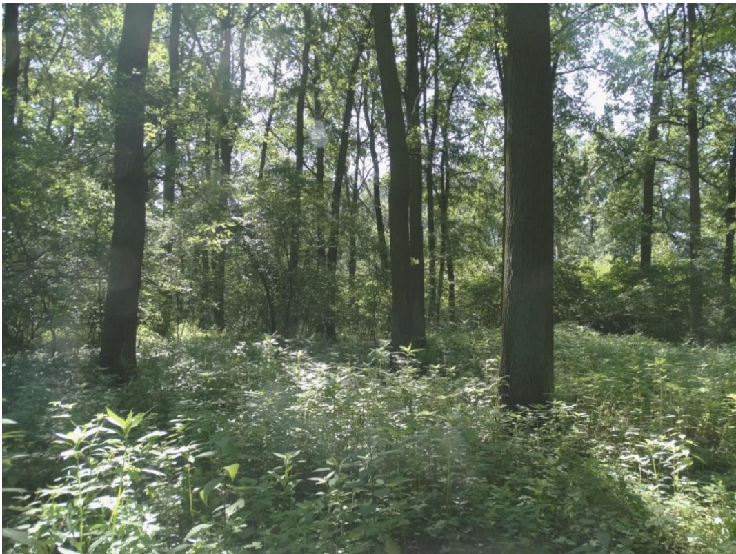
Fot. 1. Niecierpek gruczołowy w płacie siedliska 91E0.