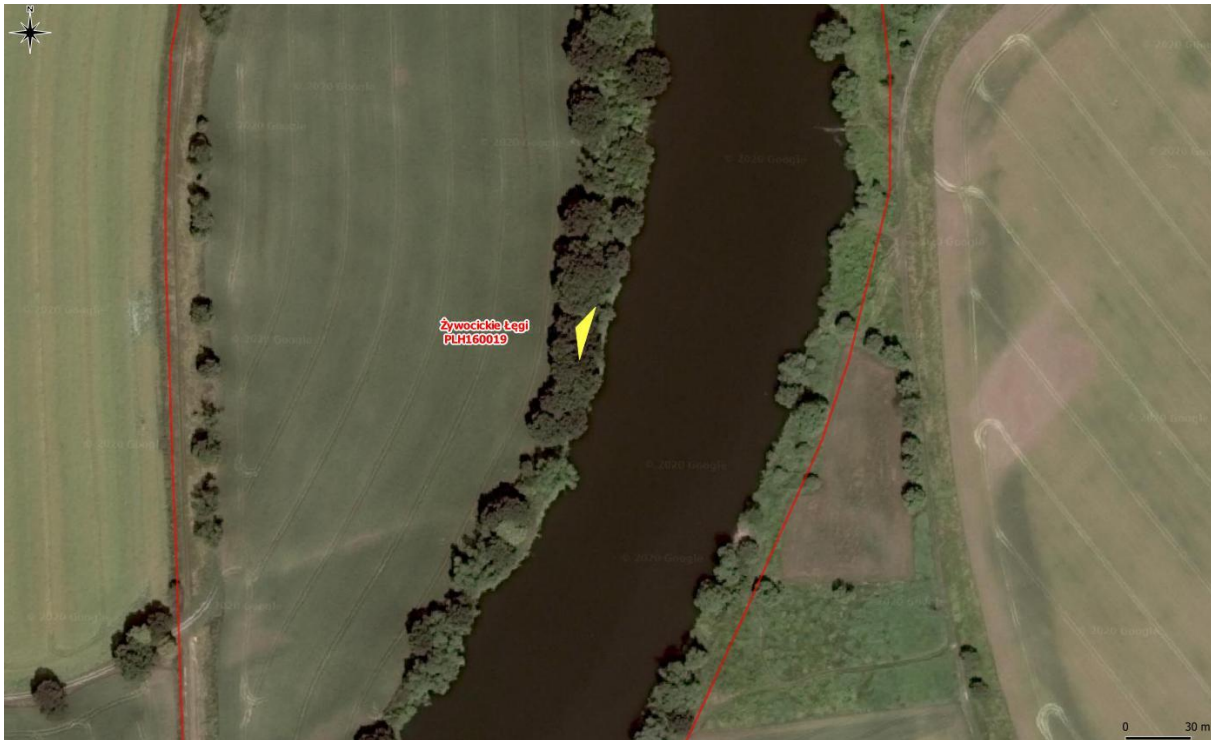
Rys. 3. Mapa poglądowa – powierzchnia występowania rdestowca na dz. 417 obręb Żywocice

Zinventaryzowane powierzchnie przedstawiono na mapach (Rys. 1-3). Stopień pokrycia niecierpka na płatach wynosi od 20% do 100% ich powierzchni (przeciętnie 50%), zaś rdestowca 80%. Teren miejscami jest trudno dostępny - płyty gatunków inwazyjnych znajdują się na obszarach pokrytych roślinnością leśną, w wilgotnych zagłębieniach terenu, skarpach rzeki i w znacznej odległości od dróg (fot. 1-3).