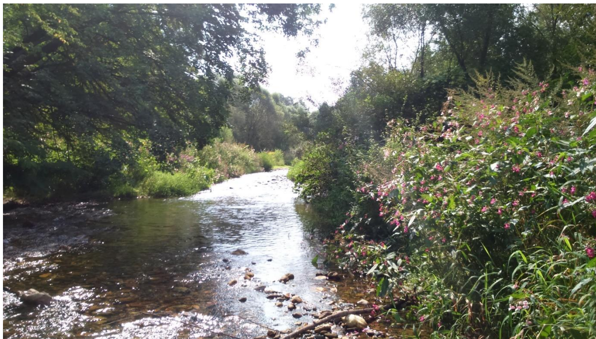
Fot. 1. Niecierpek gruczołowaty w płacie siedliska 91E0.