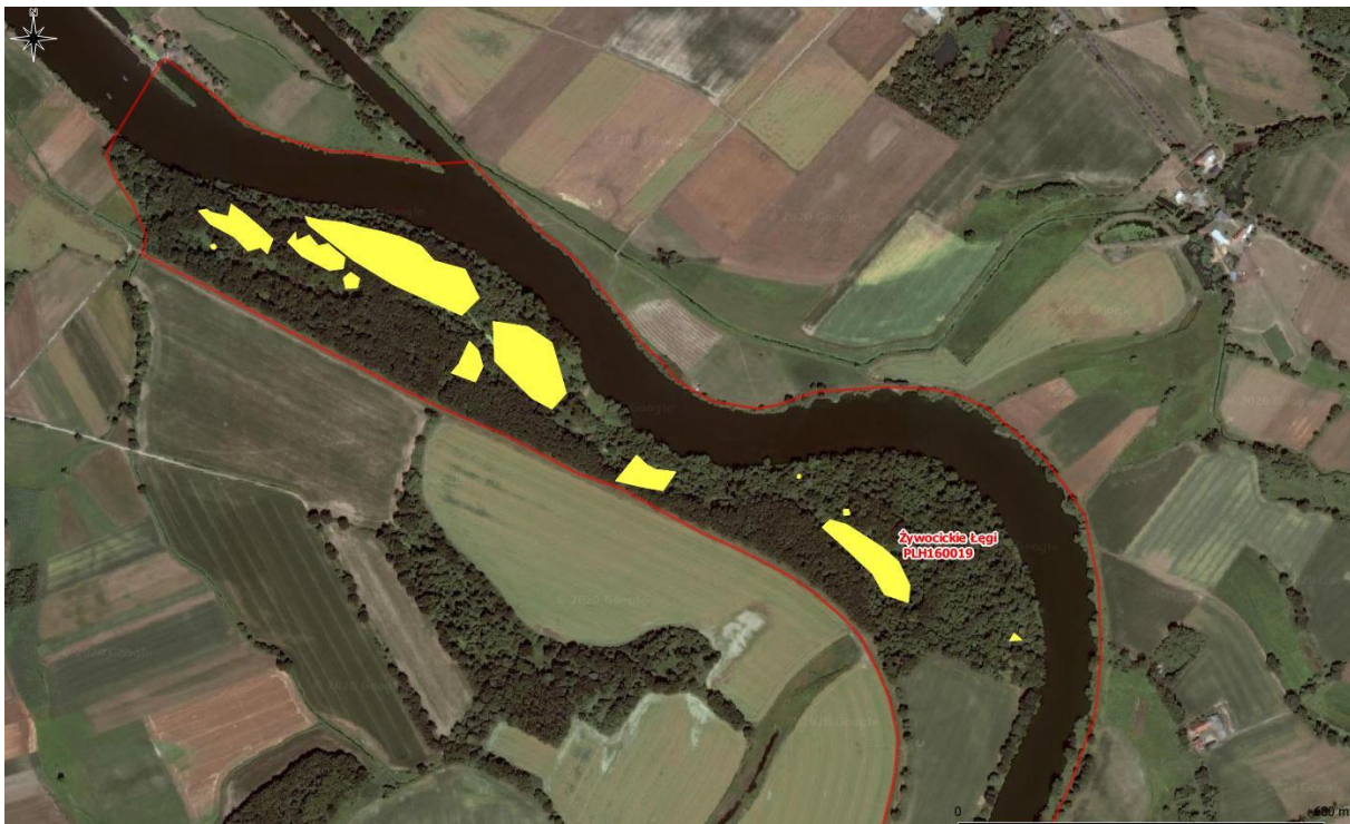
Rys. 1. Mapa pogładowa – powierzchnie występowania niecierpka gruczołowatego (część północna)