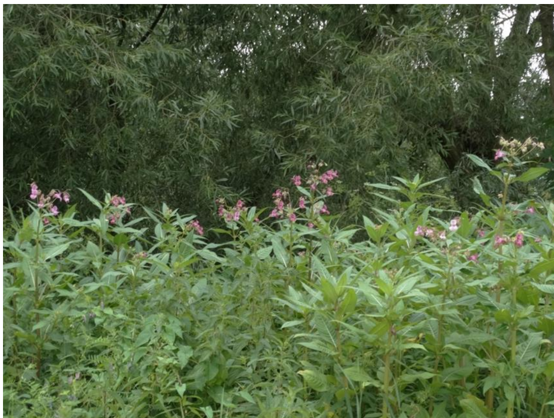
Fot. 2. Niecierpek gruczołowy w wilgotnym zagłębieniu terenu.