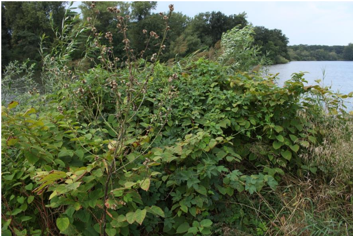
Fot. 3. Płat rdestowca przed zwalczaniem.