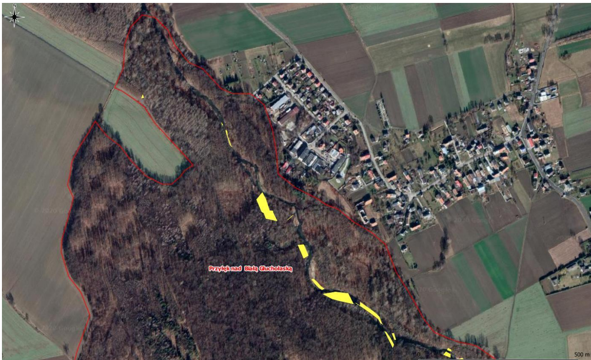
Rys. 1. Mapa poglądowa – powierzchnie występowania niecierpka gruczołowatego (część północna)