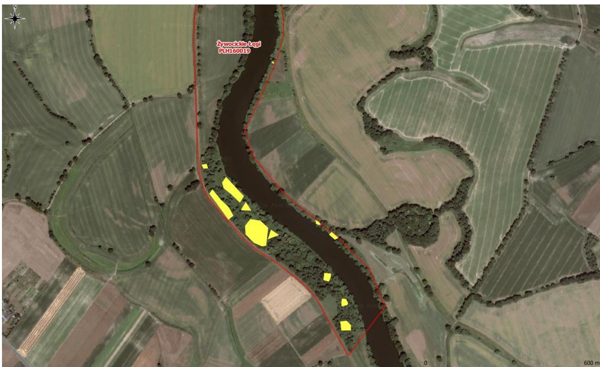
Rys. 2. Mapa pogładowa – powierzchnie występowania niecierpka gruczołowatego (część południowa)