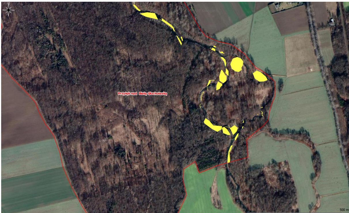
Rys. 2. Mapa poglądowa – powierzchnie występowania niecierpka gruczołowatego (część południowa)

Zinventaryzowane powierzchnie przedstawiono na mapach (rys. 1 i rys. 2). Stopień pokrycia niecierpka na płatach wynosi od 20% do 100% ich powierzchni (przeciętnie 60%). Teren miejscami jest trudno dostępny - płaty gatunków inwazyjnych znajdują się na obszarach pokrytych roślinnością leśną, na wyspach otoczonych wodą, na skarpach rzeki, w znacznej odległości od dróg (fot. 1).