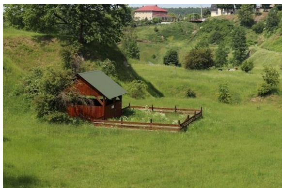
Fot.2 Widok na zadaszoną zagrodę dla owiec.