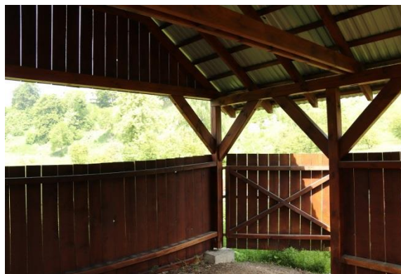
Fot.3 Wnętrze zagrody dla owiec.