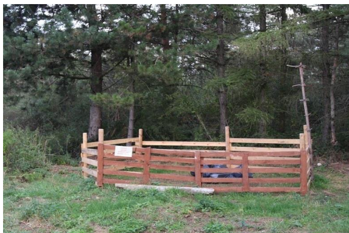
Fot. 6 Widok na zagrodę przeznaczoną dla owiec.

Posadowienie schronienia lub wykorzystanie istniejącej zagrody bez zadaszenia jest możliwe na gruntach zarządzanych przez PGL LP Nadleśnictwo Strzelce Opolskie (Fot.6) lub na gruntach będących własnością Gminy Strzelce Opolskie, przylegających do miejsca wypasu - po uprzednim uzgodnieniu tej możliwości z zarządcą ww. nieruchomości. Uzgodnienie możliwości koszarowania na ww. gruntach leży po stronie Wykonawcy.