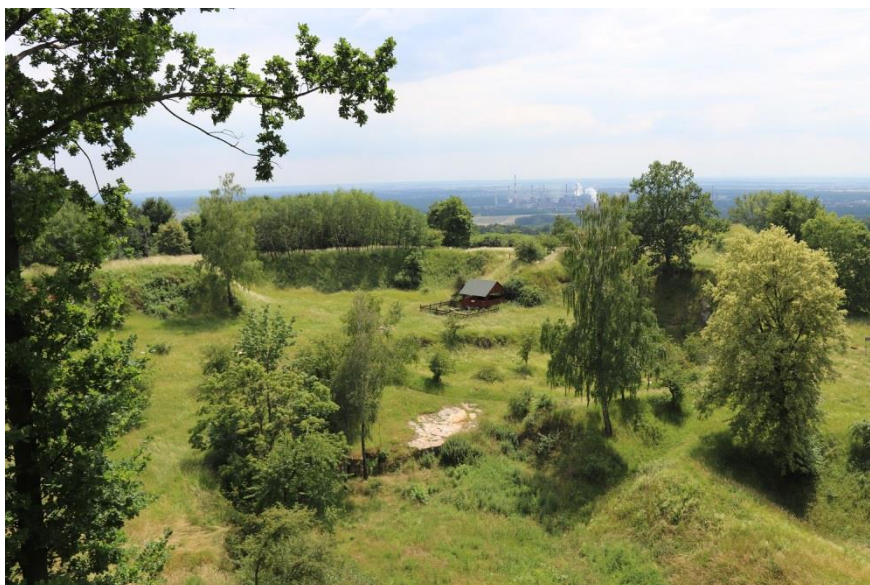
Fot.1 Widok na obszar przeznaczony do wypasu owiec na stanowisku w Górze Św. Anny.