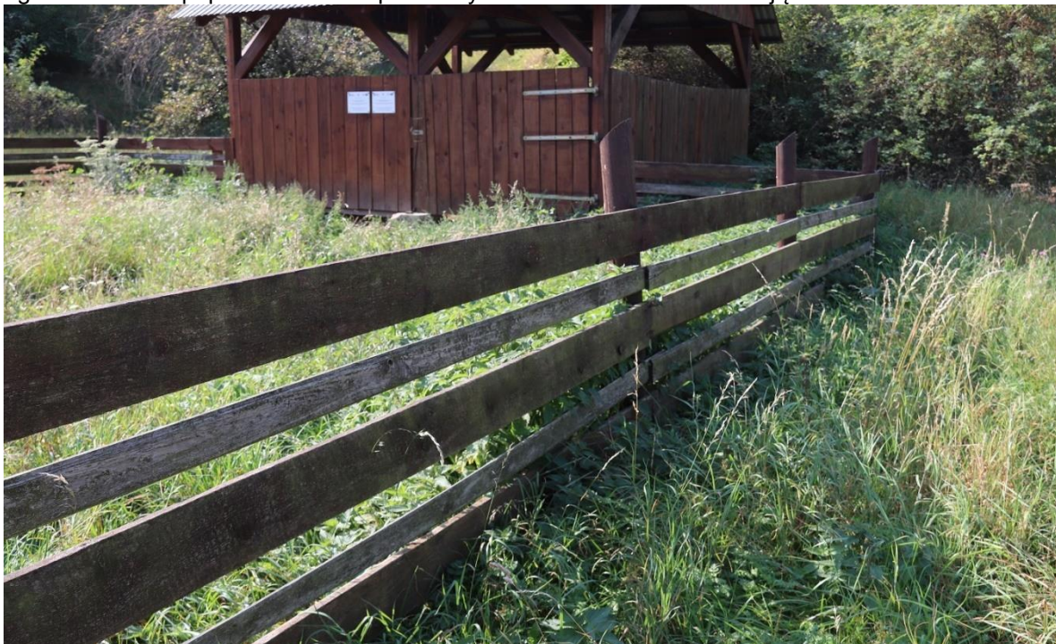
Fot.4. Widok na zachodnią część ogrodzenia i wiaty- potrzeba wymiany desek oraz konserwacji.