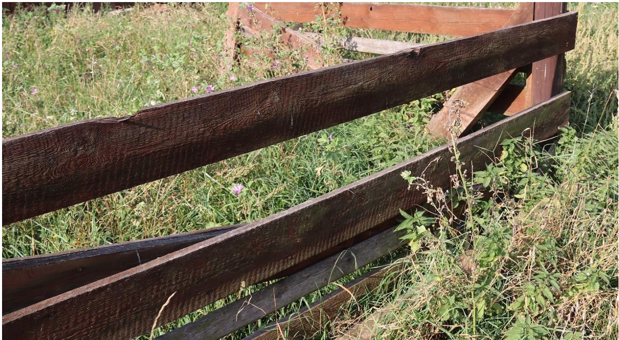
Fot.5. Północna część ogrodzenia wraz z bramą wejściową - potrzeba uzupełnienia desek oraz konserwacji.