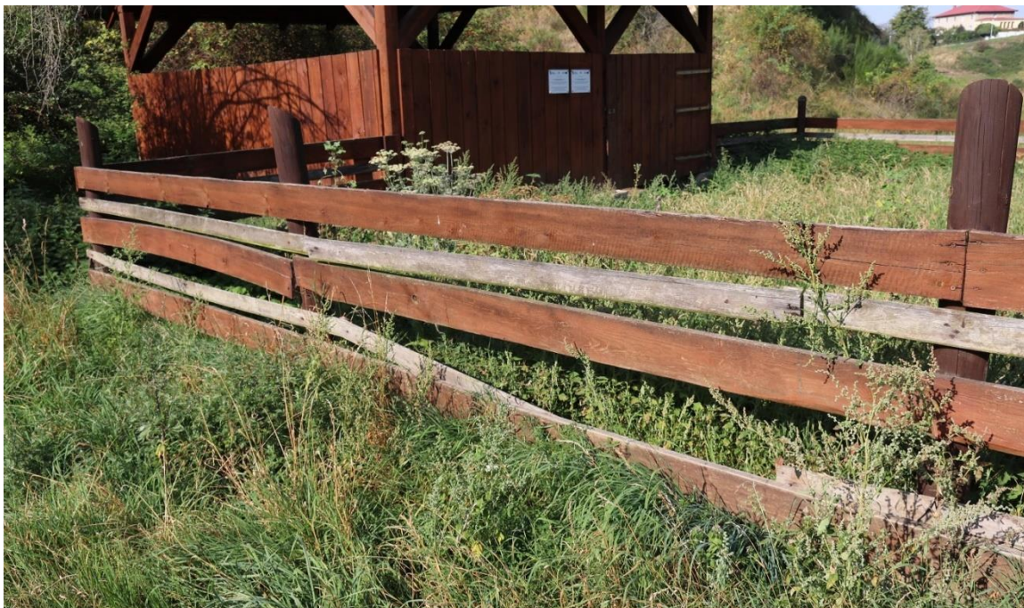
Fot.2. Wschodnia część ogrodzenia- widoczne deski do uzupełnienia i konserwacji.