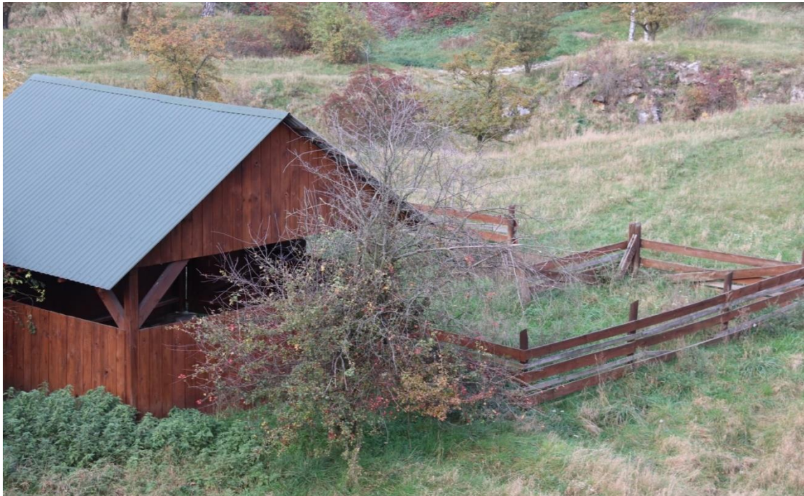
Fot.1. Widok na wiatę z drewnianym ogrodzeniem.