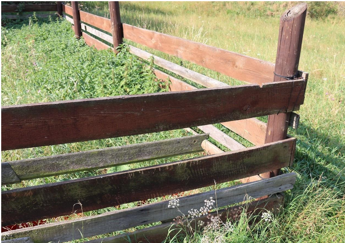
Fot.3. Słupek na rogu północno- zachodniej części ogrodzenia – potrzeba uzupełnienia desek w ogrodzeniu oraz poprawa montażu pozostałych desek wraz z konserwacją.