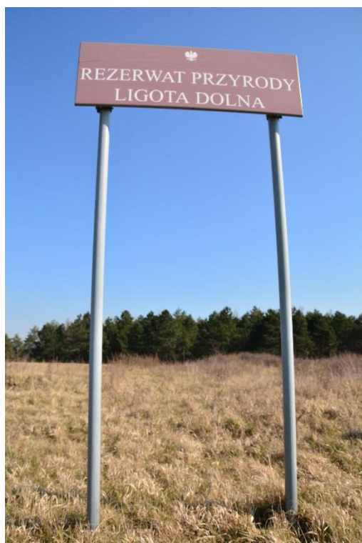
Ryc. 5 RP Ligota Dolna – tablica do demontażu