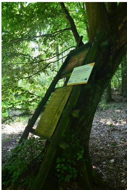
Ryc.3 RP Komorzno – tablica do demontażu