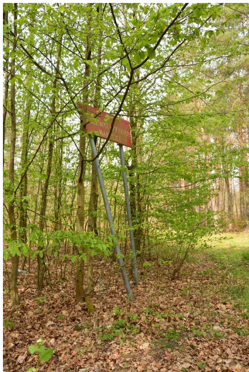
Ryc.1 RP Barucice – tablica do naprawy