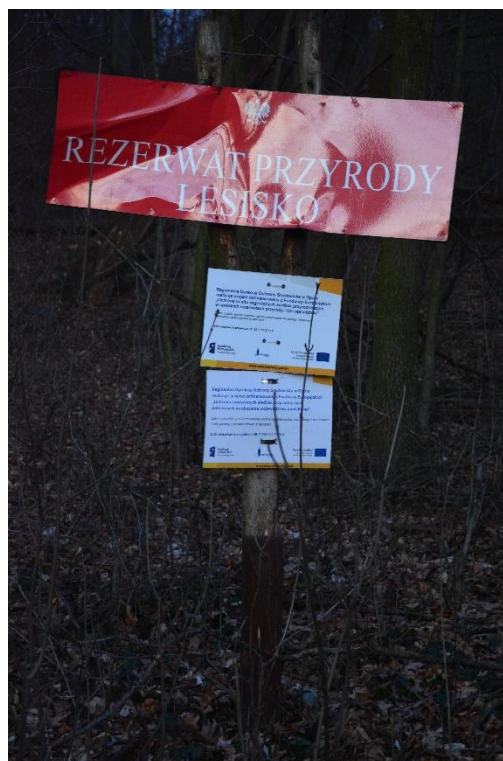
Ryc.4 RP Lesisko – tablica do demontażu