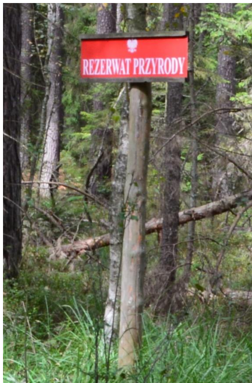
Ryc.2 RP Kamieniec – tablica do demontażu