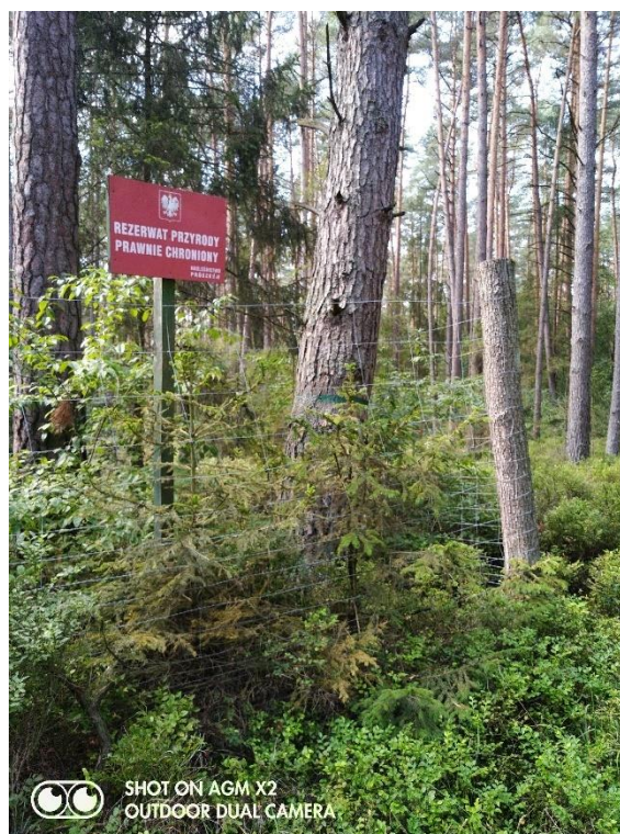
Ryc. 6 Nadleśnictwo Prószków – tablica do dem