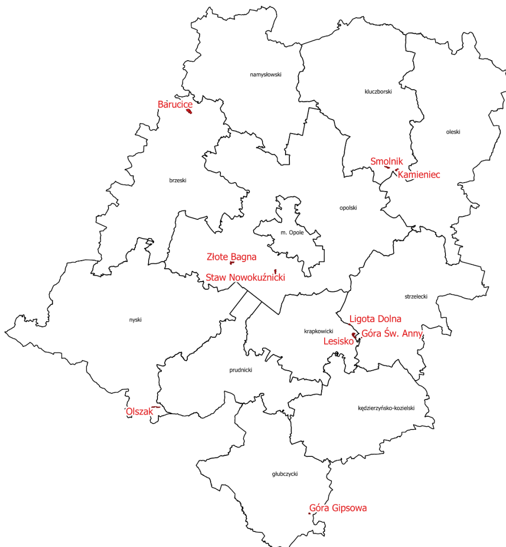
Ryc. 2 Rozmieszczenie wybranych 10 rezerwatów przyrody wyznaczonych do wykonania zdjęć sferycznych