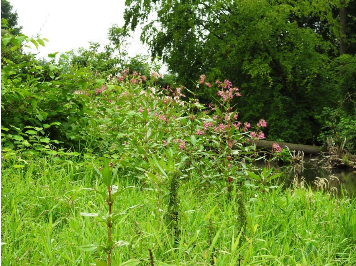
Fot. 1. Niecierpek gruczołowaty w płacie siedliska 91E0 (koniec lipca 2016 r.)