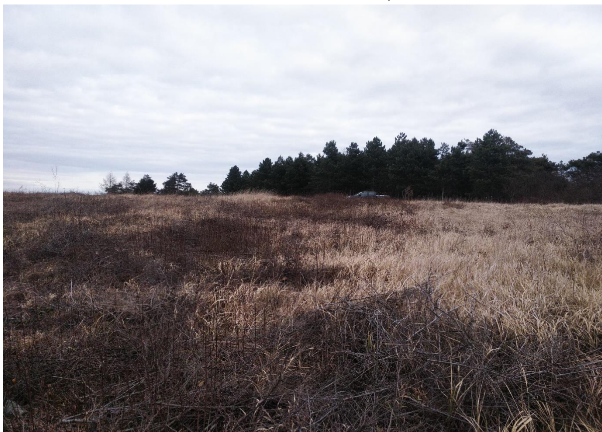
Zdj. 3. Powierzchnia przeznaczona do wykaszania na wyłasczeniu rezerwatu