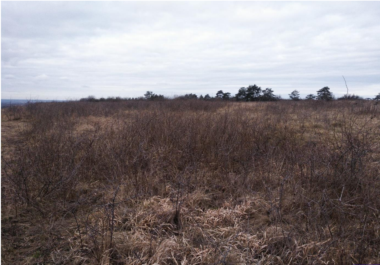
Zdj. 1. Powierzchnia przeznaczona do wykaszania na wypłaszczeniu rezerwatu