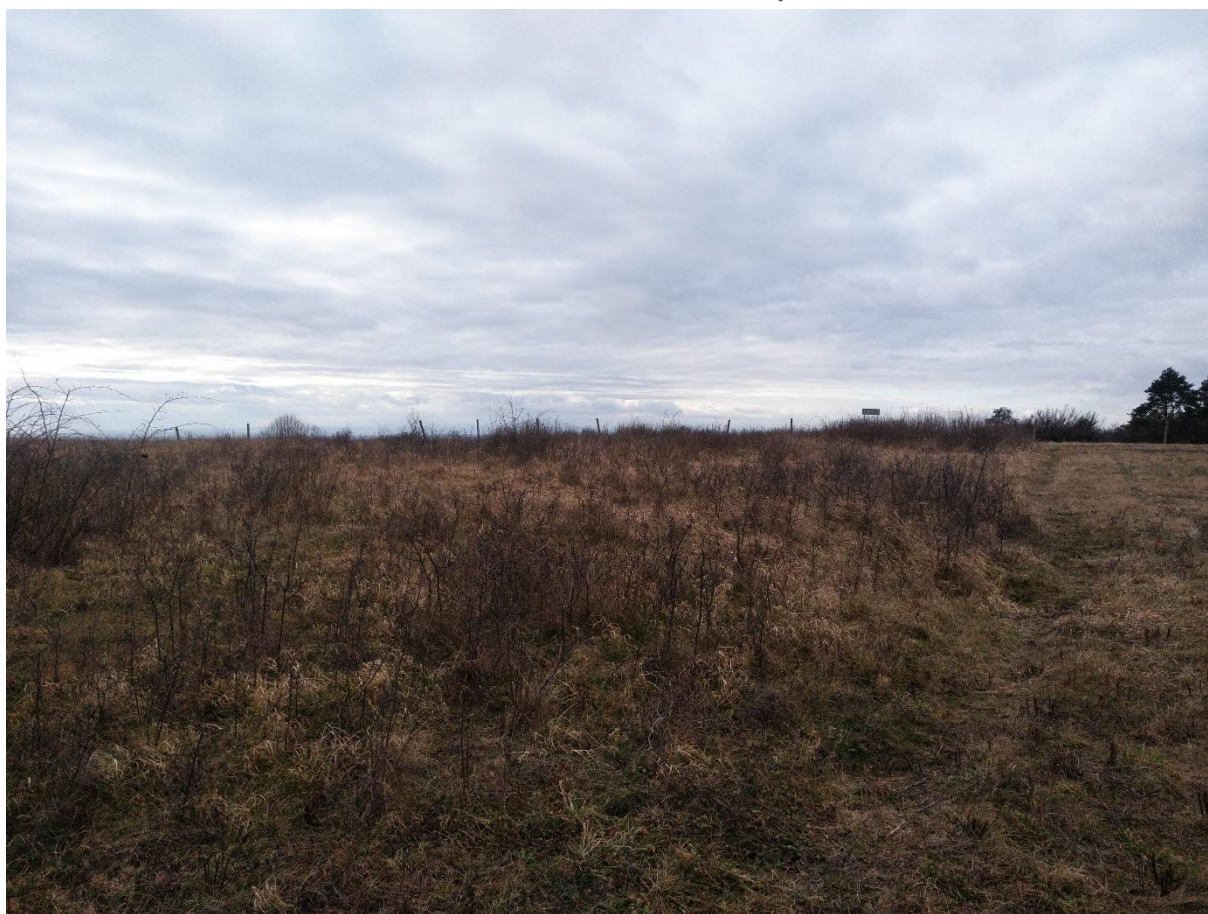
Zdj. 4. Powierzchnia przeznaczona do wykaszania na wypłaszczeniu rezerwatu