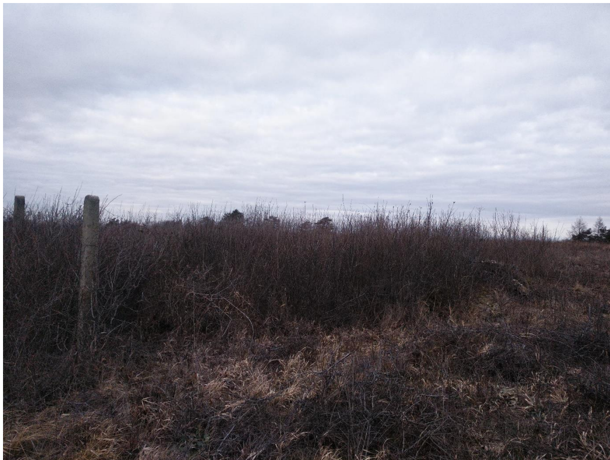
Zdj. 2. Powierzchnia przeznaczona do wykaszania na wyłuszczeniu rezerwatu