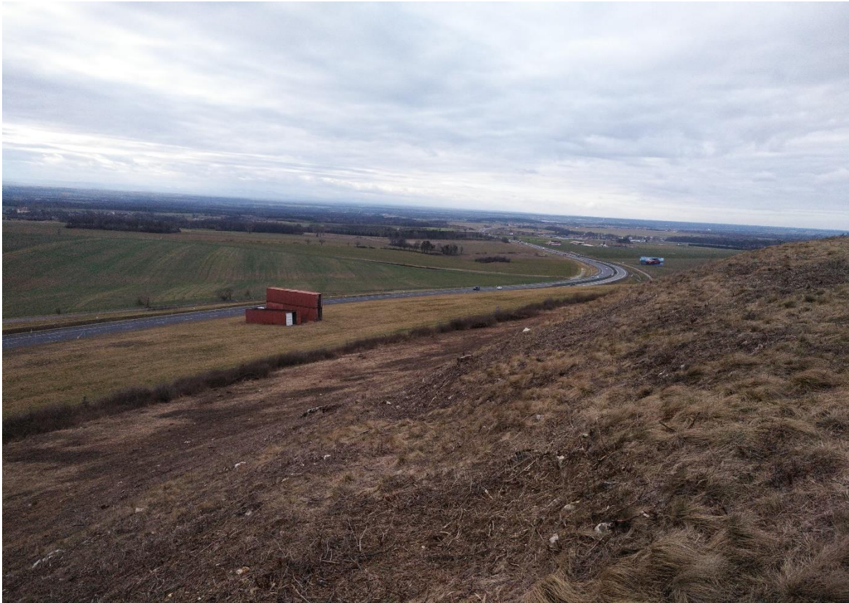
Zdj. 5. Powierzchnia przeznaczona do wykaszania na zboczu (zdjęcie wykonane w styczniu)