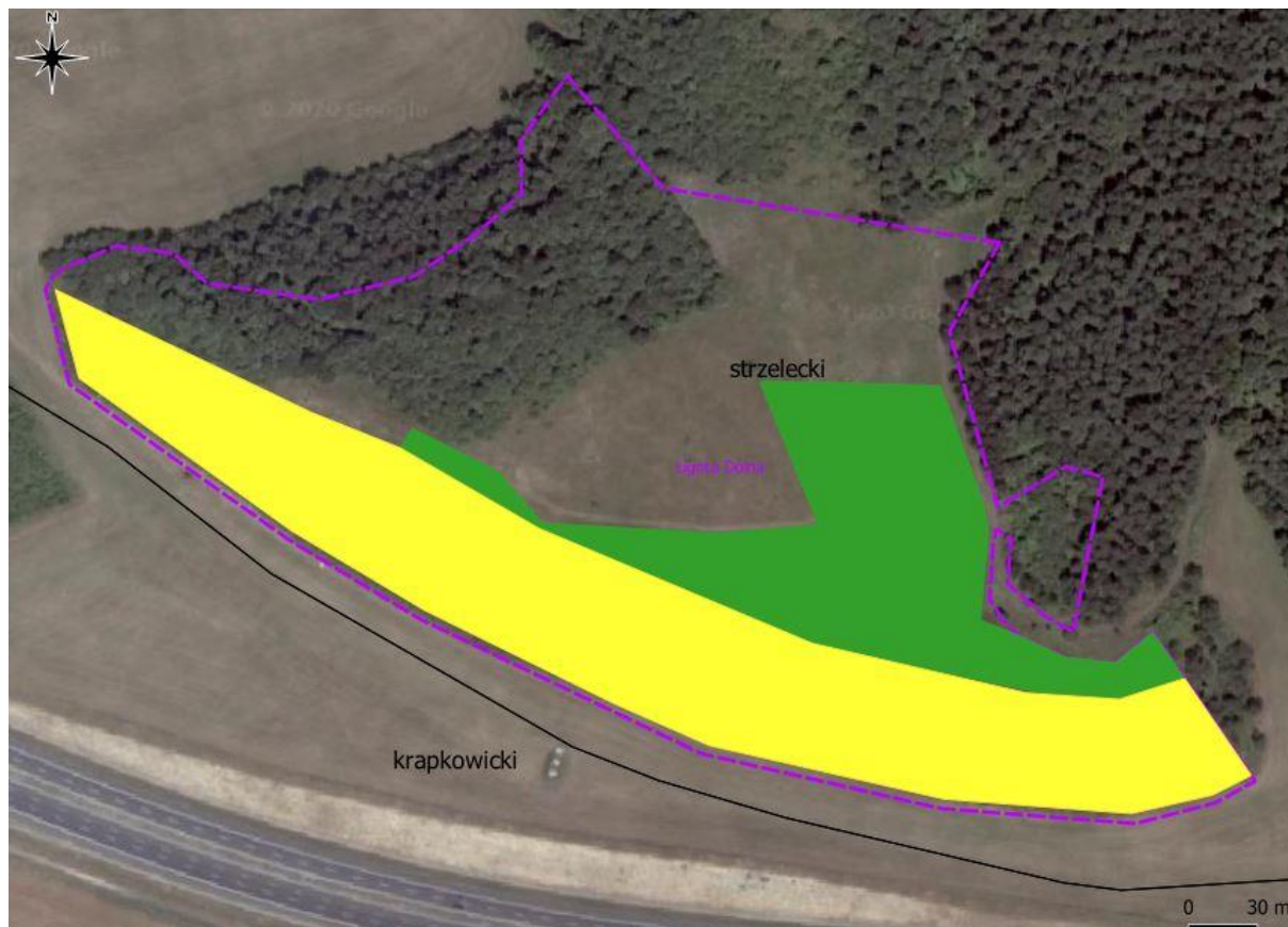
Ryc. 1. Orientacyjna powierzchnia wykaszania w rezerwacie przyrody Ligota Dolna (kolor zielony- wypłaszczenie rezerwatu, kolor żółty- zbocze)

Termin wykonania zabiegu: 15.09.2020 r. -15.10.2020 r.