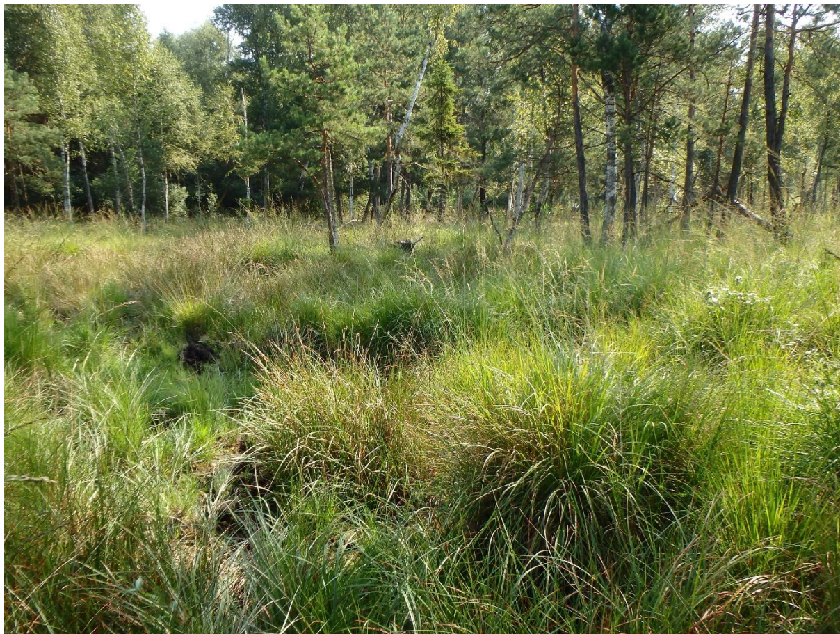
Zdj. 1. Widok ogólny stanowiska (rezerwat przyrody „Prądy” teren silnie podmokły i bagienny)