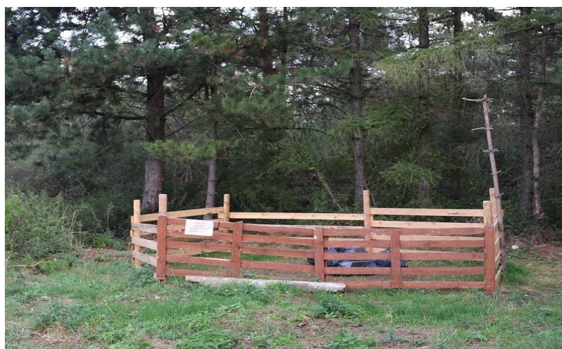
Fot. 6 Widok na zagrodę przeznaczoną dla owiec.

Posadowienie schronienia lub wykorzystanie istniejącej zagrody bez zadaszenia jest możliwe na gruntach zarządzanych przez PGL LP Nadleśnictwo Strzelce Opolskie (Fot.6) lub na gruntach będących własnością Gminy Strzelce Opolskie, przylegających do miejsca wypasu; po uprzednim uzgodnieniu tej możliwości z zarządcą ww. nieruchomości. Uzgodnienie możliwości koszarowania na ww. gruntach leży po stronie Wykonawcy.