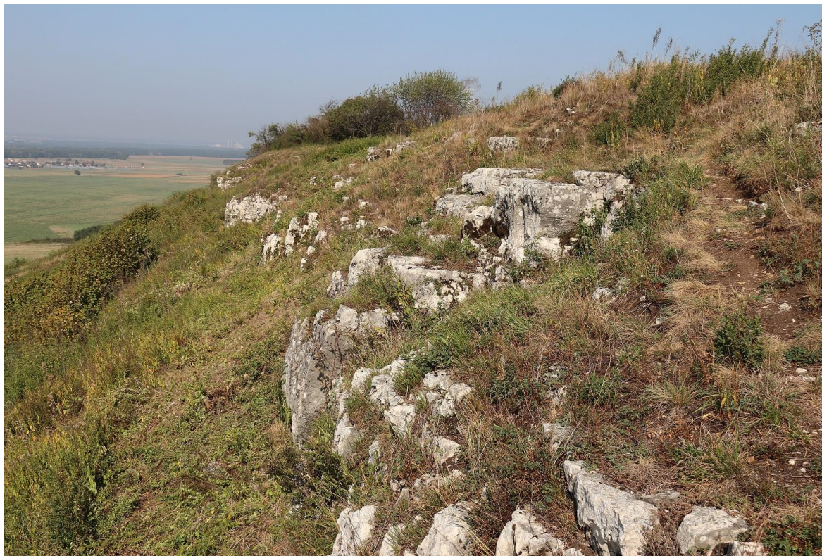
Fot.5. Teren wykonania prac związanych z usuwaniem roślinności zielnej.

Usuwanie roślinności zielnej obejmuje teren o dużym nachyleniu, co obrazuje poniższe zdjęcie (Fot.5).