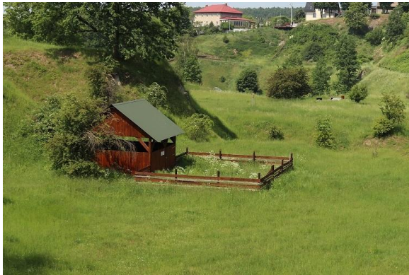
Fot.2 Widok na zadaszoną zagrodę dla owiec.