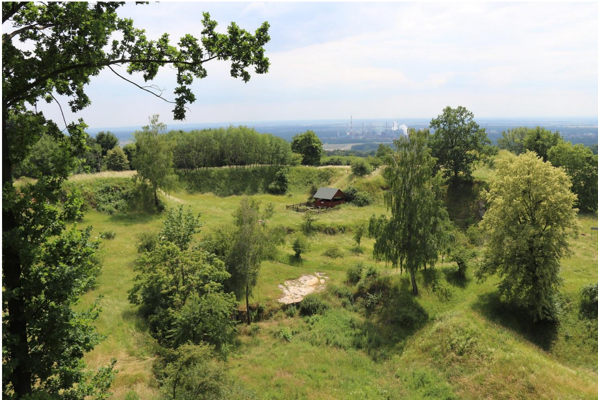
Fot.1 Widok na obszar przeznaczony do wypasu owiec na stanowisku w Górze Św. Anny.