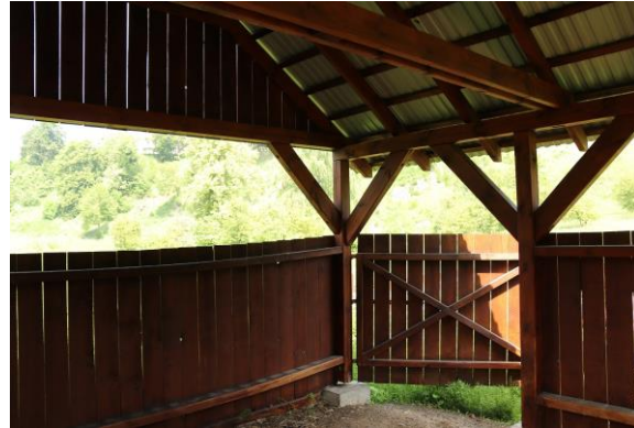
Fot.3 Wnętrze zagrody dla owiec.