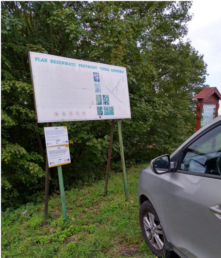
Ryc. 4 Duża tablica do demontażu w granicach RP Góra Gipsowa