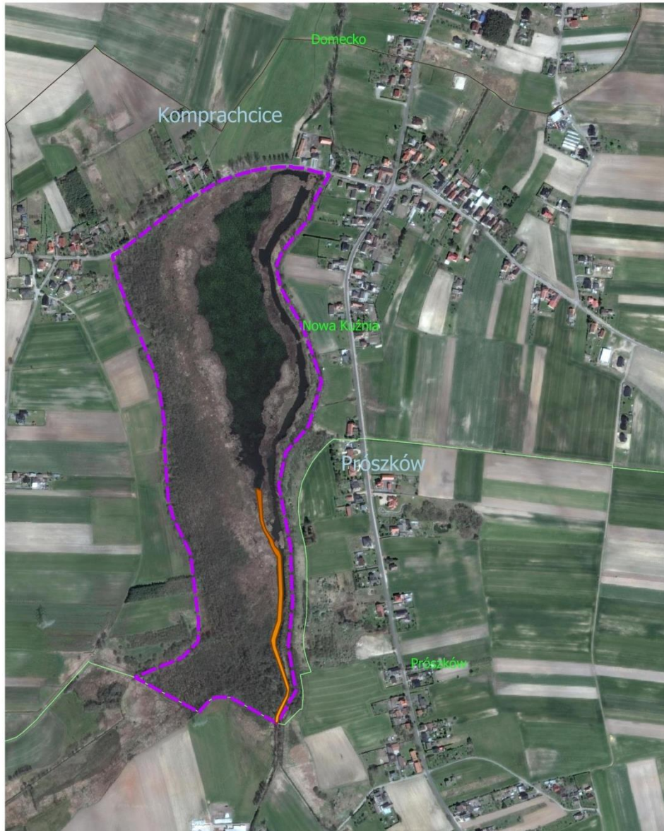
Ryc. 1 Rezerwat przyrody Staw Nowokuźnicki wraz z zaznaczonym odcinkiem rzeki Prószkówki przeznaczonym do wykonania bieżącej konserwacji