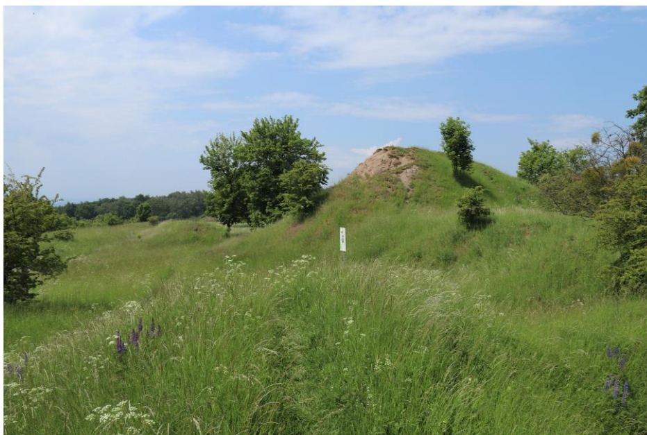
Fot.2 Część południowa działki nr 201/1