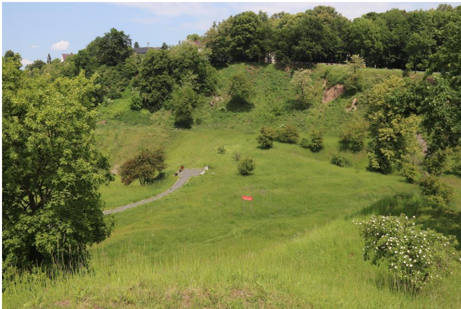
Fot.1 Widok na działki: nr 201/17 i nr 201/1

Poniżej zdjęcia przedstawiające ukształtowanie ww. terenu.