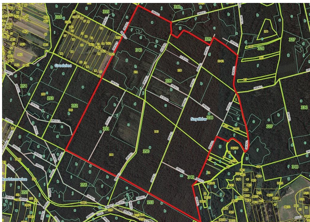
Mapa 2. Obszar objęty pracami – widok szczegółowy, z uwzględnieniem wydzieli leśnych oraz dróg gruntowych.