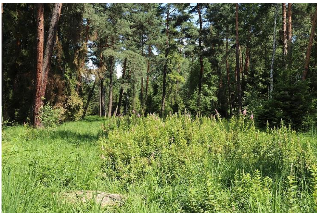
Fot.1. Płat zwartej tawuły porastający brzegi cieku wodnego w obszarze objętym pracami.