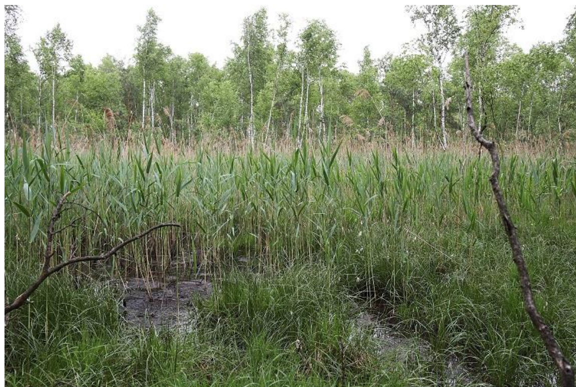
Fot. 1. Widok ogólny stanowiska: rezerwat przyrody „Prądy” (teren silnie podmokły i bagienny).