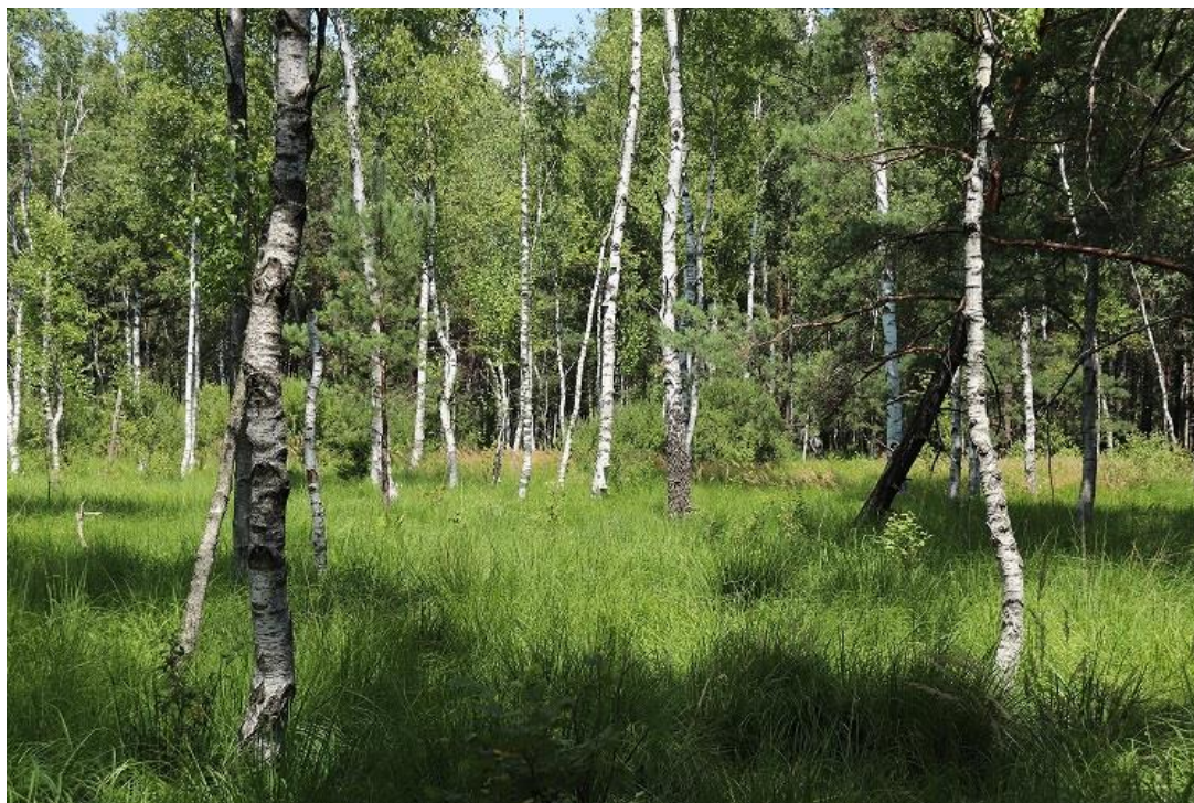
Fot. 2 Widok ogólny stanowiska: rezerwat przyrody „Złote Bagna”(teren silnie podmokły i bagienny). W tle widoczne zamierające brzozy.

Miejsca prowadzenia zabiegów wraz z załącznikiem graficznym ( tj. lokalizacja płatów tawuły kutnerowatej i trzciny pospolitej objętych zamówieniem, miejsca pozostawienia (składowania) biomasy w terenie), zostaną wskazane, a materiały graficzne przekazane Wykonawcy przez Zamawiającego po podpisaniu umowy, w uzgodnionym wcześniej terminie. Wskazanie wraz z przekazaniem odbędzie się w godzinach pracy Zamawiającego (pn.-pt. w godz. 7.30 – 15.30).